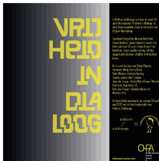
Asser Fotografen – Vrijheid in dialog