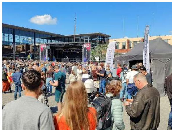
Koningsdag, foto: Esther van Riezen