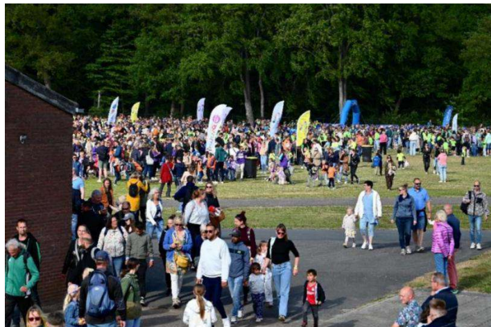
Sector Sport – Avond 4-Daagse, foto: Assen Sportstad