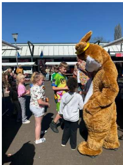
Winkelcentrum Nobellaan – Paasactiviteiten

Naast de markten stonden kinderactiviteiten centraal in het programma. Deze werden goed bezocht en positief gewaardeerd. Een bijzonder hoogtepunt was de Burendag, die het winkelcentrum dit jaar groots aanpakte. Een initiatief dat de verbinding tussen ondernemers en wijkbewoners merkbaar versterkte.