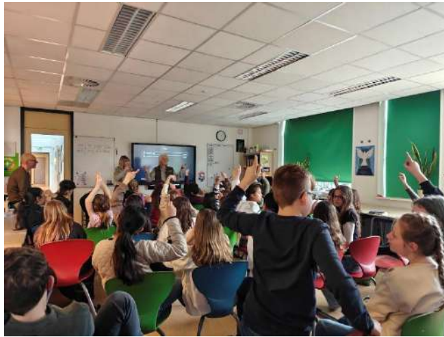
Natuurfilm Habitat in de klas