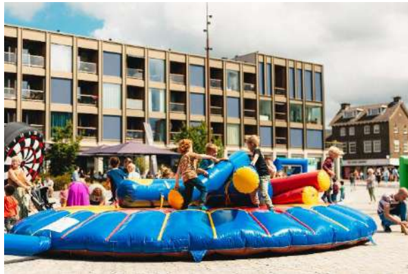
Kids zomervermaak activiteiten, foto: Vaart in Assen