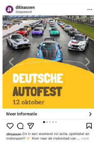
TRP Assen – online campagnes – o.a. Deutsche Autofest

Aan de stadsmarketingboard leverde TRP cofinanciering voor landelijke onlinecampagnes. Via Google Display en betaalde social media-content werd Assen zichtbaar gemaakt in de Randstad en Noord-Brabant, gericht op het aantrekken van dagjesmensen en hotelgasten.