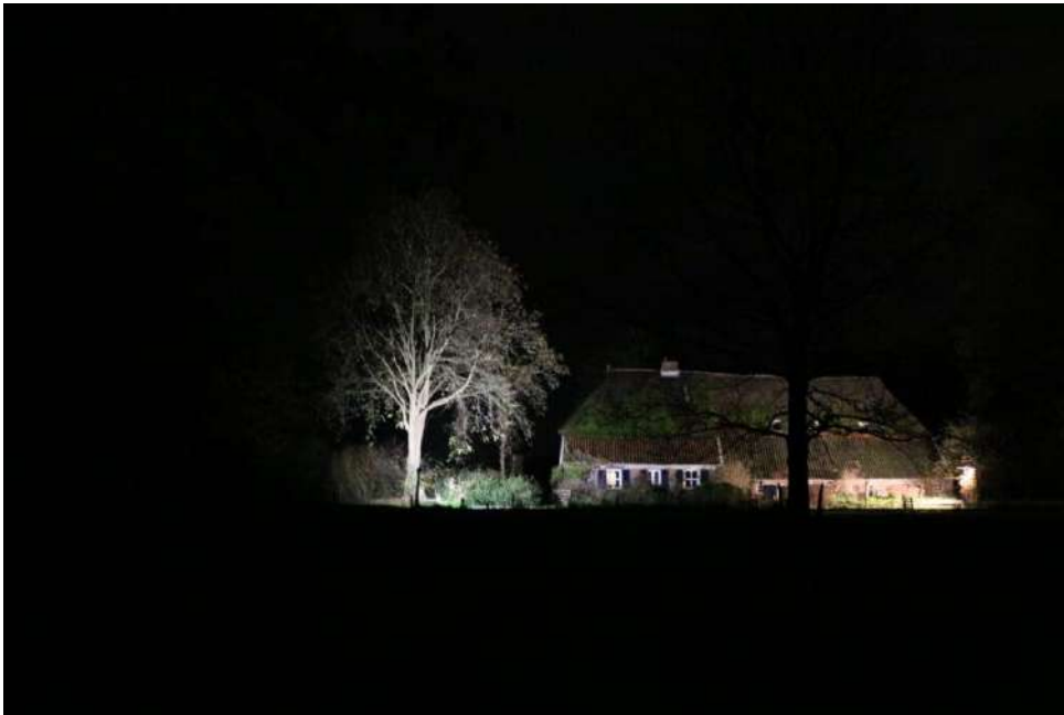
Sector Agrarisch – Lichtjesroute

In december organiseerde de Sector Agrarisch een Lichtjesroute langs agrarische bedrijven, waarmee ook in het donkere seizoen zichtbaarheid werd gecreëerd.