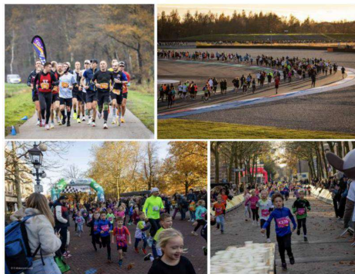
Sector Sport – TT City Run