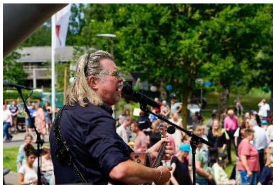
Jubileum 70 jaar Vanboeijen

24. Haringparty – netwerkevent voor ondernemers