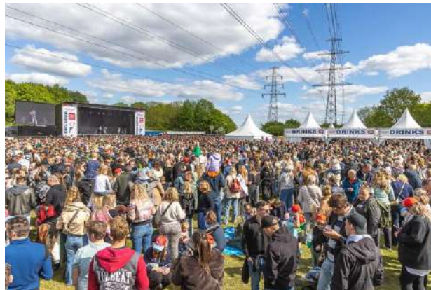
Bevrijdingsfestival Drenthe