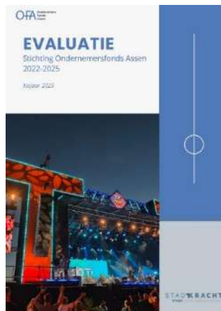
StadsKracht – Evaluatierapport OFA 2022-2025