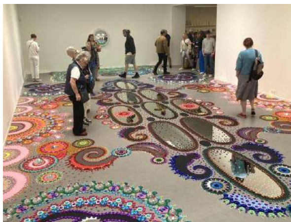
Zachte Krachten