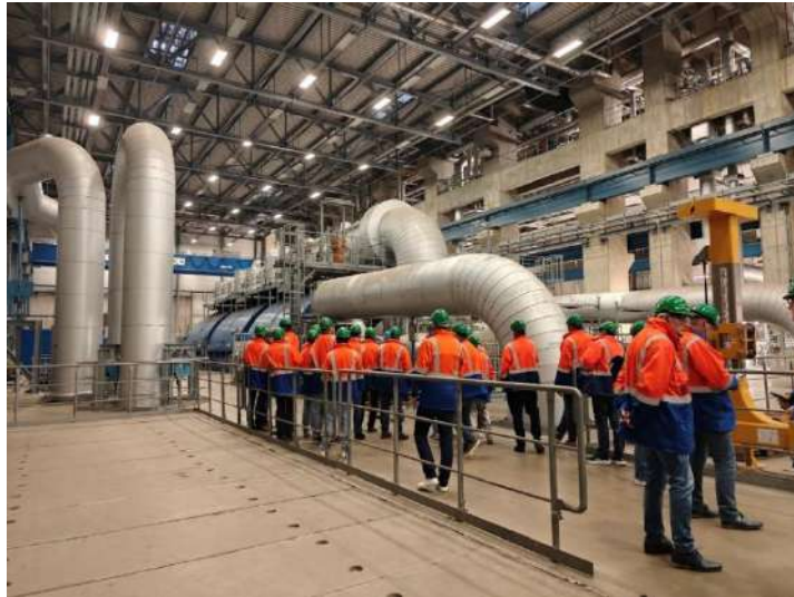
Ondernemend Assen - Excursie RWE in de Eemshaven

In het najaar stond een excursie naar RWE in de Eemshaven op het programma, waarbij leden een exclusief kijkje kregen in de werking van energiecentrales.