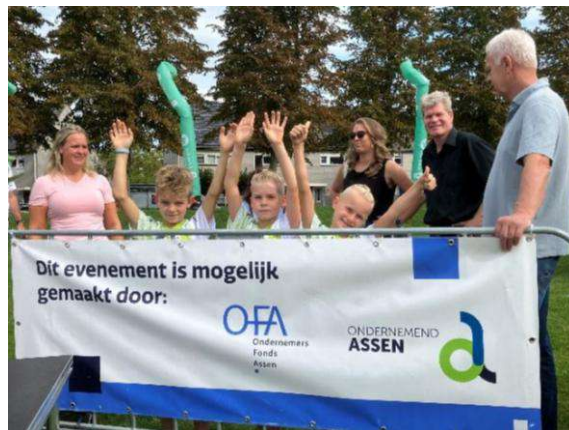
4 Mijl