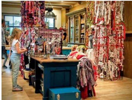
Kunst aan de Vaart, cultuureducatie Met Elkaar Verweven, foto: Esther van Riezen