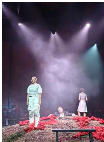
Graan theatervoorstelling