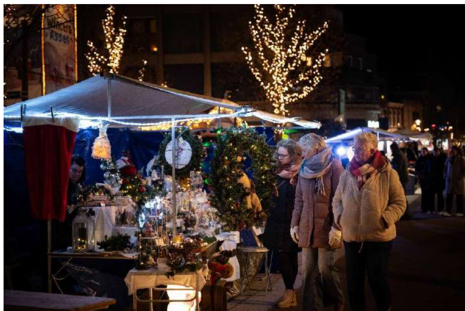
MKB Retail/Vaart in Assen – Kerstmarkt, foto: Lammert Aling