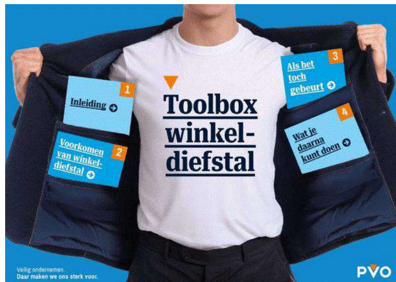
MKB Retail/Vaart in Assen – Toolbox Winkeldiefstal