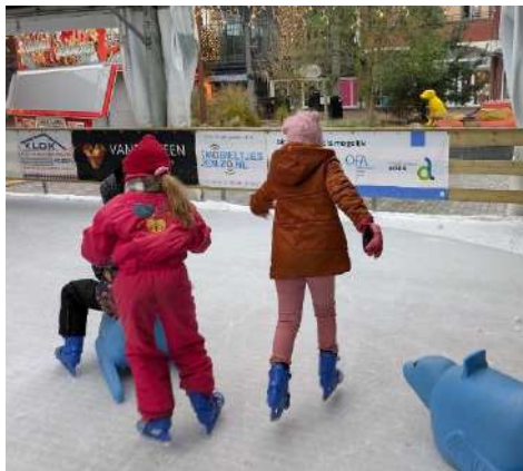
Winters Assen ijsbaan