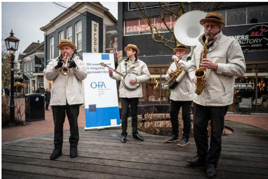
Asser Bluesdagen 2025