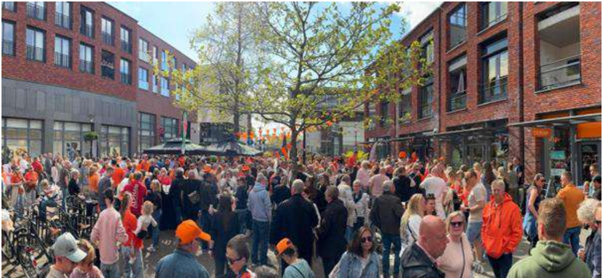
MKB Retail Assen/Vaart in Assen – Koningsdag