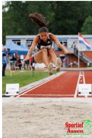
St. Topatletiek Noord Nederland, foto: St. Topatletiek NN