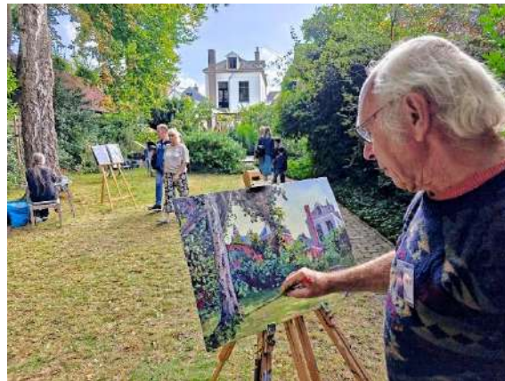
Kunst aan de Vaart