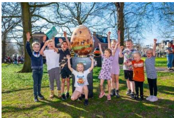
MKB Retail Assen/Vaart in Assen – Paaseieren op de Brink