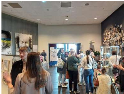
Cultuurmaanden Oekraïne