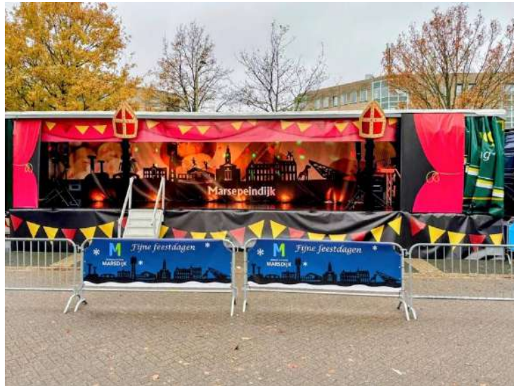
Winkelcentrum Marsdijk – Aankleding podium Sinterklaasintocht, foto: Winkelcentrum Marsdijk

Voor de Sinterklaasintocht is nieuwe aankleding voor het podium aangeschaft.