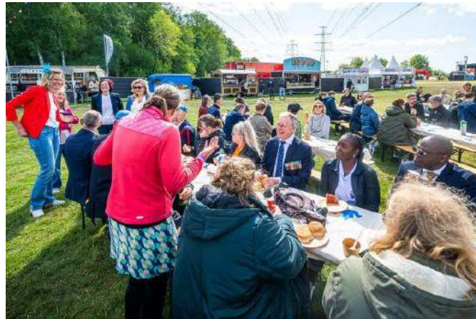
Branche Overheid/Defensie – Vrijheidslunch XXL