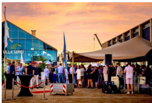
Haringparty, foto: Ondernemend Assen

24. Haringparty – netwerkevent voor ondernemers