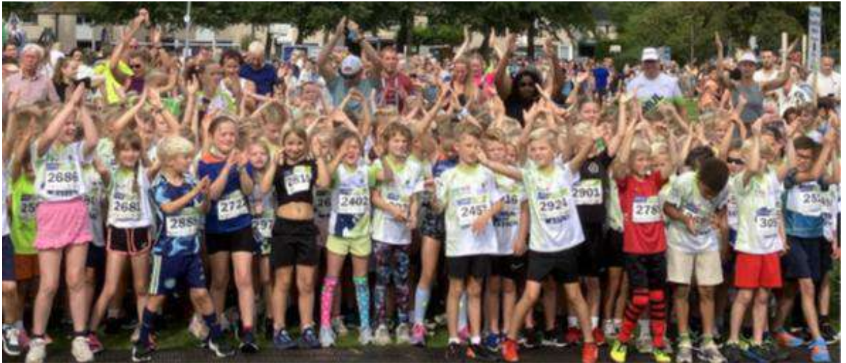
Sector Sport – Kidsrun 4 Mijl van Assen