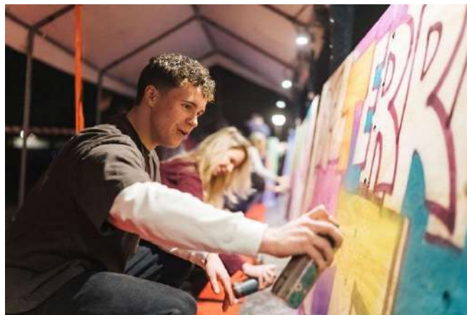
Cultuur en muziek event, foto: Drenthe College