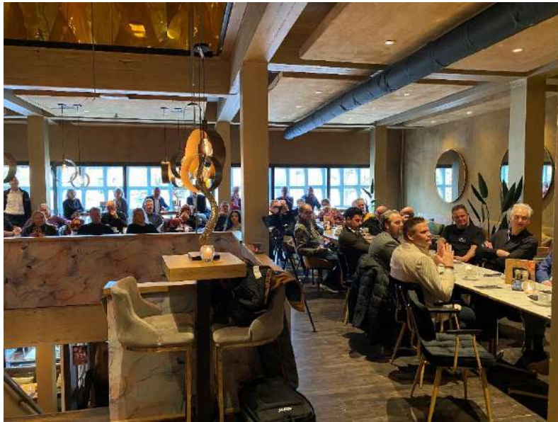
Branche Zorg – Event Drempels Weg, foto: Toegankelijk Uit Eten