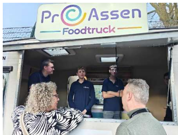
Branche Onderwijs, van caravan naar Foodtruck