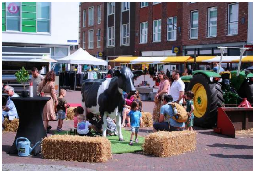
Winkelcentrum Kloosterveste – Boer & Oude Ambacht markt, foto: Winkelcentrum Kloosterveste

Ter gelegenheid van het 50-jarig jubileum van het winkelcentrum zijn aanvullende activiteiten georganiseerd.