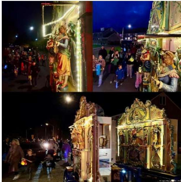
Winkelcentrum Peelo – St. Maartensoptocht door Peelo met 400 kinderen

De 38e Sint-Maartensoptocht op 11 november trok ongeveer 400 kinderen uit de wijk. De route liep langs scholen, het winkelcentrum en het wijkgebouw, en sloot af bij het bejaardencentrum. Alle kinderen ontvingen een zakje snoep.