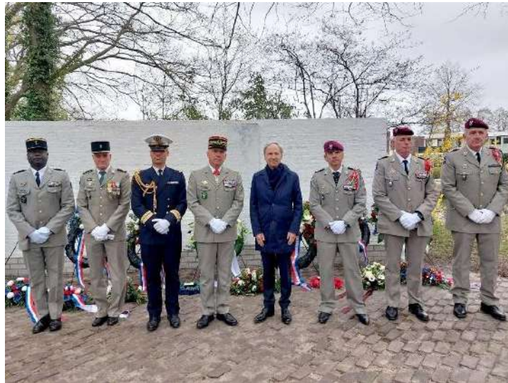
St. Herdenking Franse parachutisten – 80 jaar Vrijheid

In 2025 vierde de TT haar 100-jarige jubileum en werd het TT Festival voor de 50 ste keer georganiseerd. Ook 80 jaar Vrijheid was een thema waar veel organisaties bij aanhaakten.