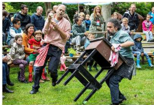
Art of Wonder, foto: Moon Saris