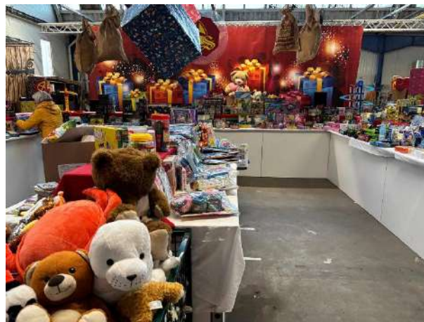
Branche Overheid/Defensie – Sinterklaasactie Assen, foto: Esther van Riezen