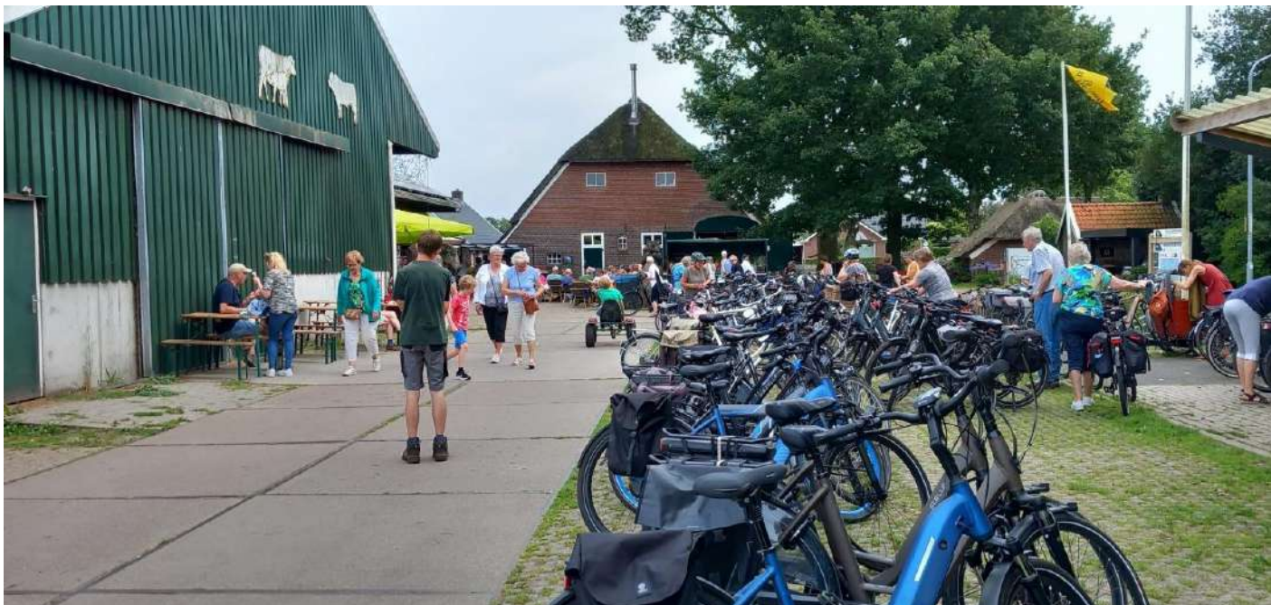
Sector Agrarisch – Boerenfietstocht

In de zomer vonden de al jaren zeer succesvolle Boerenfietstochten plaats in de omgeving van Rolde en Assen. Rond de 1500 belangstellenden namens een kijkje bij de deelnemende agrarische bedrijven. Voor veel deelnemers is de Boerenfietstocht een laagdrempelige manier om kennis te maken met het agrarische leven. De activiteit droeg bij aan het versterken van het imago van de sector. De deelnemende bedrijven waren blij met de oprechte belangstelling, de mogelijkheid hun bedrijf te laten zien en meer inzicht te creëren in hoe het er echt aan toe gaat in de landbouwsector. Meer informatie is beschikbaar op https://boerenfietstocht.eu/