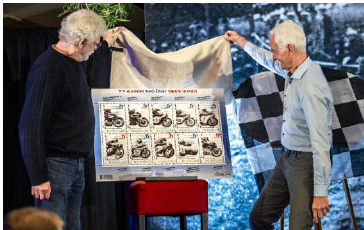
Postzegels in het kader van 100 jaar TT