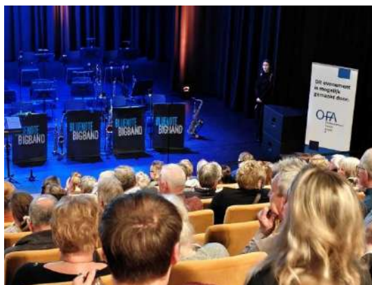
Blue Note Bigband – Jubileumconcert