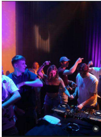
Art Beat

22. Art Beat – muziek/cultuur event voor jongeren