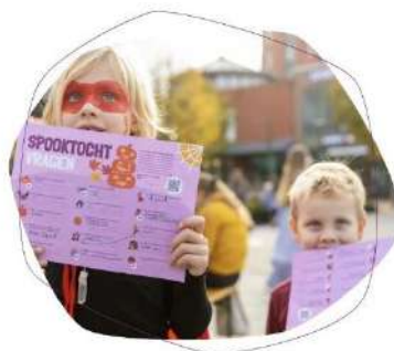
Halloween speurtocht