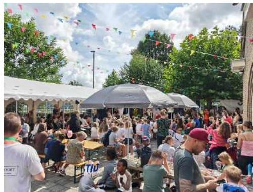
Appiedam Kinderspelweek