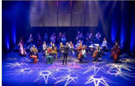
St. Somer – Somer Onbegrensd 80 jaar Vrijheid