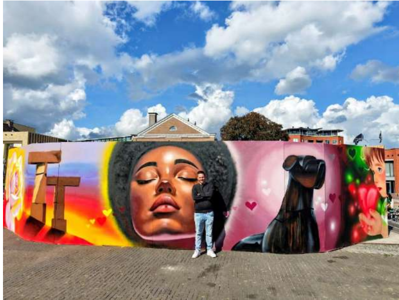
TRP Assen - Kunst aan de Vaart – TT Graffiti jongerenproject o.l.v Martijn van Steenwijk