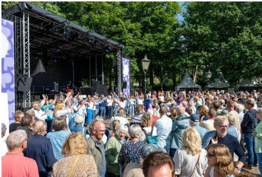
Preuvenement, foto: Esther van Riezen

Met betrekking tot MKB Retail Assen: ca. 98 % van het budget wordt direct doorgeleid naar Vaart in Assen (ViA). MKB Retail Assen is wel degene die de verantwoording over de bestedingen aflegt. Er zijn gesprekken gaande over de vraag of Vaart in Assen aangewezen dient te worden als trekkingsgerechtigde in plaats van MKB Retail Assen.