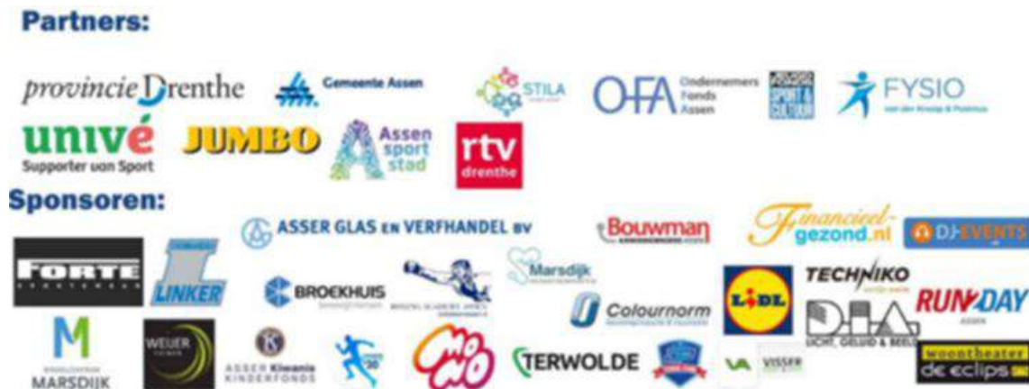
4 Mijl van Assen - sponsoren

Bij evenementen die zowel door OFA zelf als door Ondernemend Assen of een van de branches Zorg, Onderwijs en Defensie/Overheid ondersteund worden, zijn de gezamenlijke OFA/Ondernemend Assen spandoeken en banners ingezet.