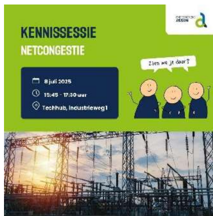
Ondernemend Assen – kennissessie Netcongestie

Nieuw in 2025 was de reeks kennissessies , met thema's als schijnzelfstandigheid, cybersecurity, netcongestie en SEO. Daarnaast is elke eerste maandag van de maand het Ondernemersloket geopend, waar adviseurs van Ondernemend Assen, gemeente Assen en Vaart in Assen gezamenlijk beschikbaar zijn om vragen van ondernemers te beantwoorden.