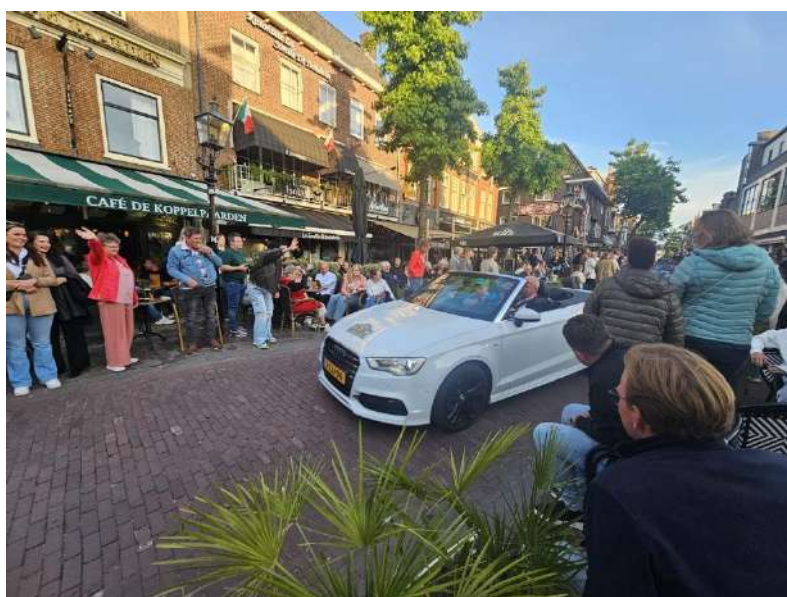
Branche Zorg – Rally zonder Poespas