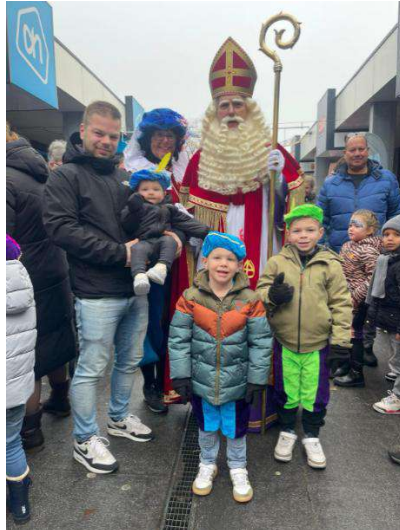
Winkelcentrum Vredeveld – Pietendag

Verder heeft het winkelcentrum haar budget uitgegeven aan gladheidsbestrijding en onderhoud van bloembakken. Het winkelcentrum vervult steeds meer de rol van centrale ontmoetingsplek in de wijk.