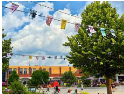
MKB Retail/Vaart in Assen – aankleding van de stad 100 jaar TT – foto's: Vaart in Assen

Het versterken van de uitstraling van de binnenstad kreeg vorm via banieren, beplakte lege etalages, sfeervolle feestverlichting en aanvullende straataankleding.