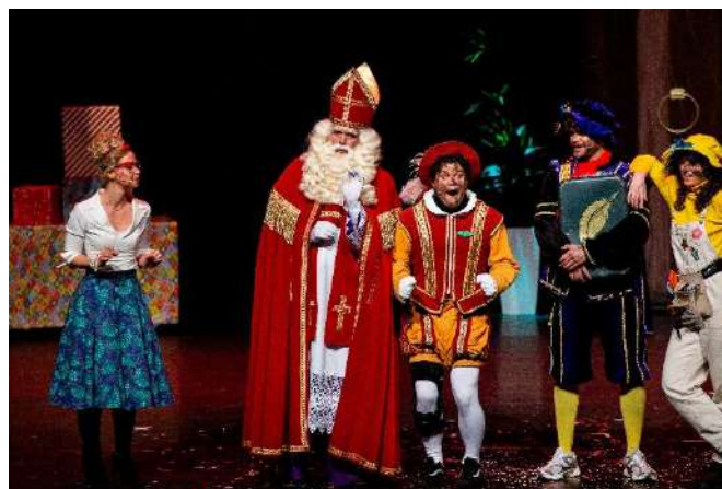
Sinterklaas theater, foto: Rianne Paardekooper