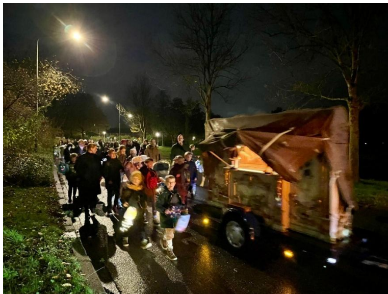
Winkelcentrum Peelo – St. Maartensoptocht door Peelo met 400 kinderen

Op 11 november heeft Winkelcentrum Peelo de 37 ste Sint Maartensoptocht gehouden. De route liep langs scholen, het winkelcentrum, het wijkgebouw en een instelling voor ouderen. De OFA-bijdrage is gebruikt om de 400 kinderen die meededen aan de Sint Maartensoptocht van een zakje snoep te voorzien. Zowel de ouders als de kinderen kijken altijd erg uit naar dit evenement.