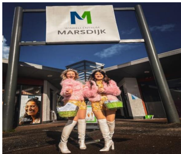
Winkelcentrum Marsdijk – Paasactie met gastdames