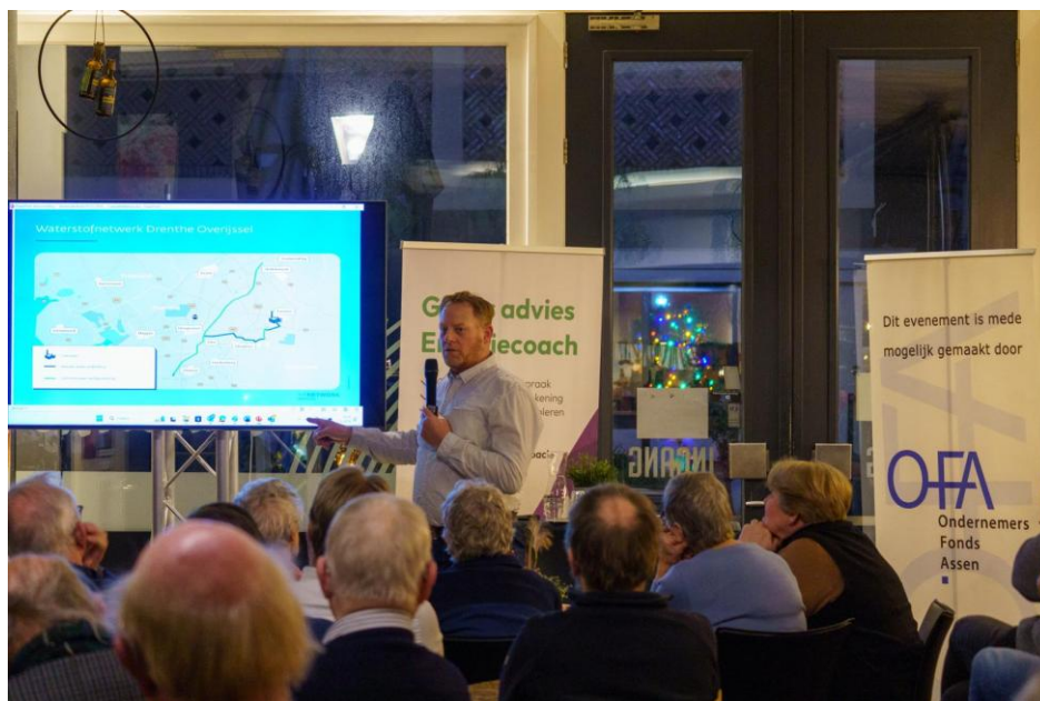
Kenniscaf  – thema Energie, foto: St. Kenniscaf  Assen