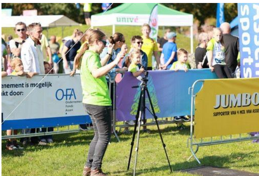
4 Mijl van Assen

Bij meerdere projecten hebben een of meerdere trekkingsgerechtigden ook een bijdrage verleend. Dit getuigt van betrokkenheid bij het belang van het centrum voor de stad.