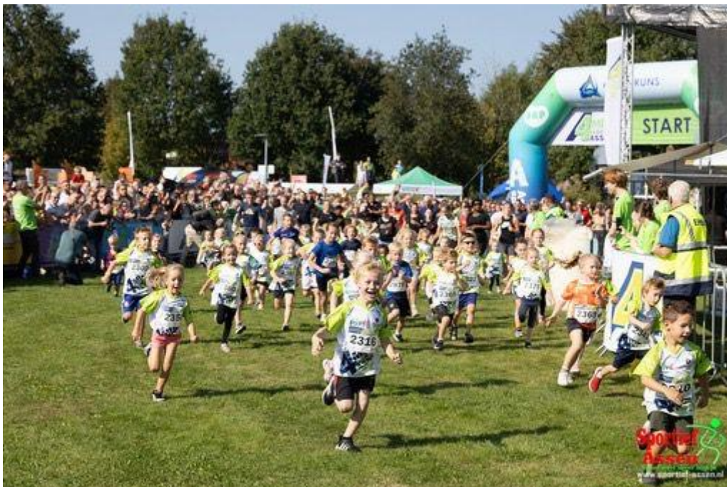
4 Mijl