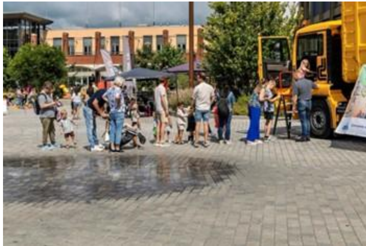
MKB Retail Assen/Vaart in Assen – Kids Zomervermaak

Vaart in Assen werkt langs de volgende vier lijnen: