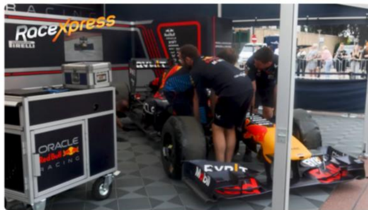
David Coulthard, Tom Coronel en meer in actie tijdens Assen City Demo