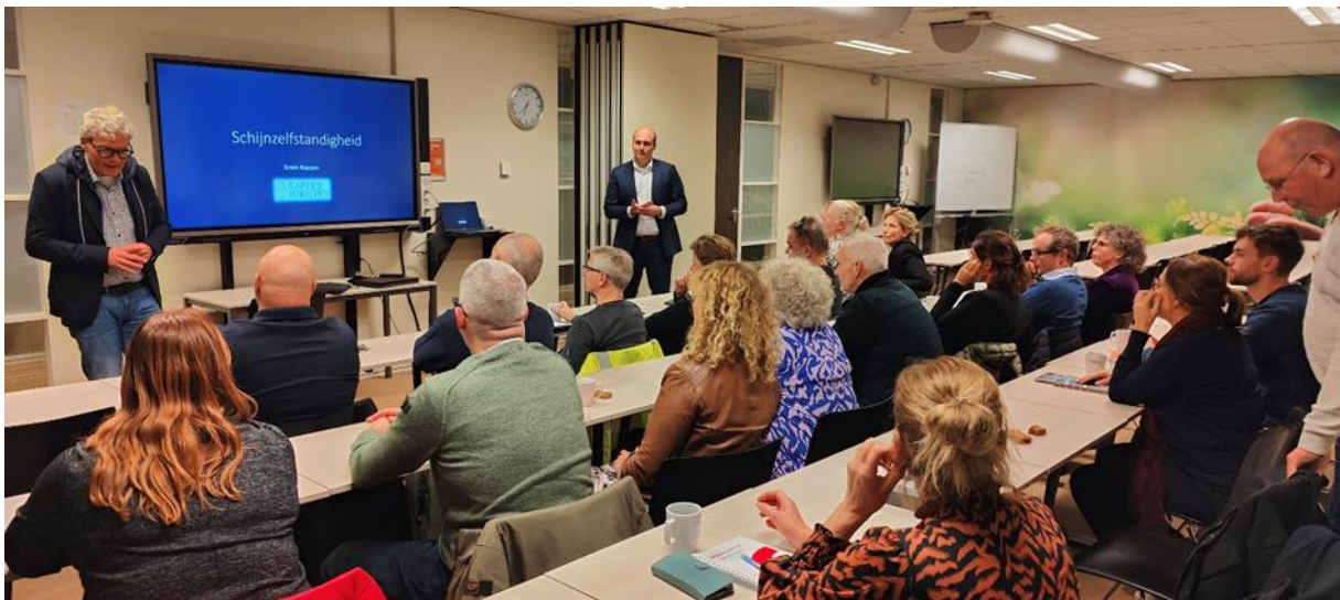
Ondernemend Assen – Kennissessie Schijnzelfstandigheid ZP

Kennissessie Schijnzelfstandigheid . De kennissessie Schijnzelfstandigheid ZP op 4 december was verhelderend en volledig volgeboekt.