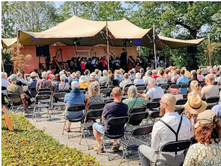
Somer - concert