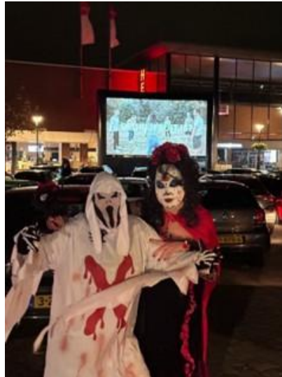
MKB Retail/Vaart in Assen – Drive inn bioscoop en Halloween