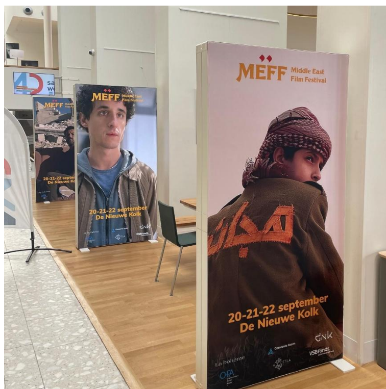
Middle East Film Festival