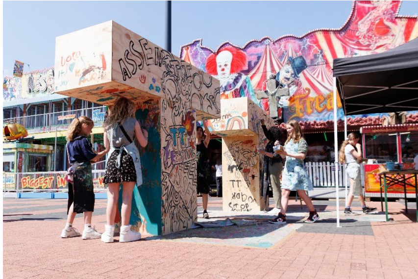
TT Festival – beschilderen houten TT's door het publiek