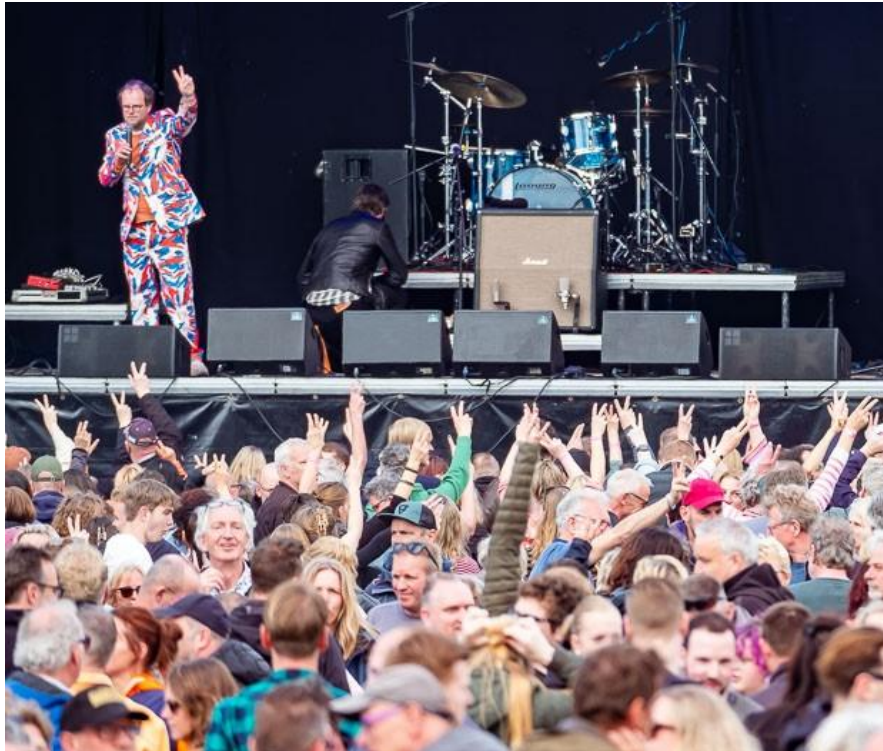
Bevrijdingsfestival Drenthe