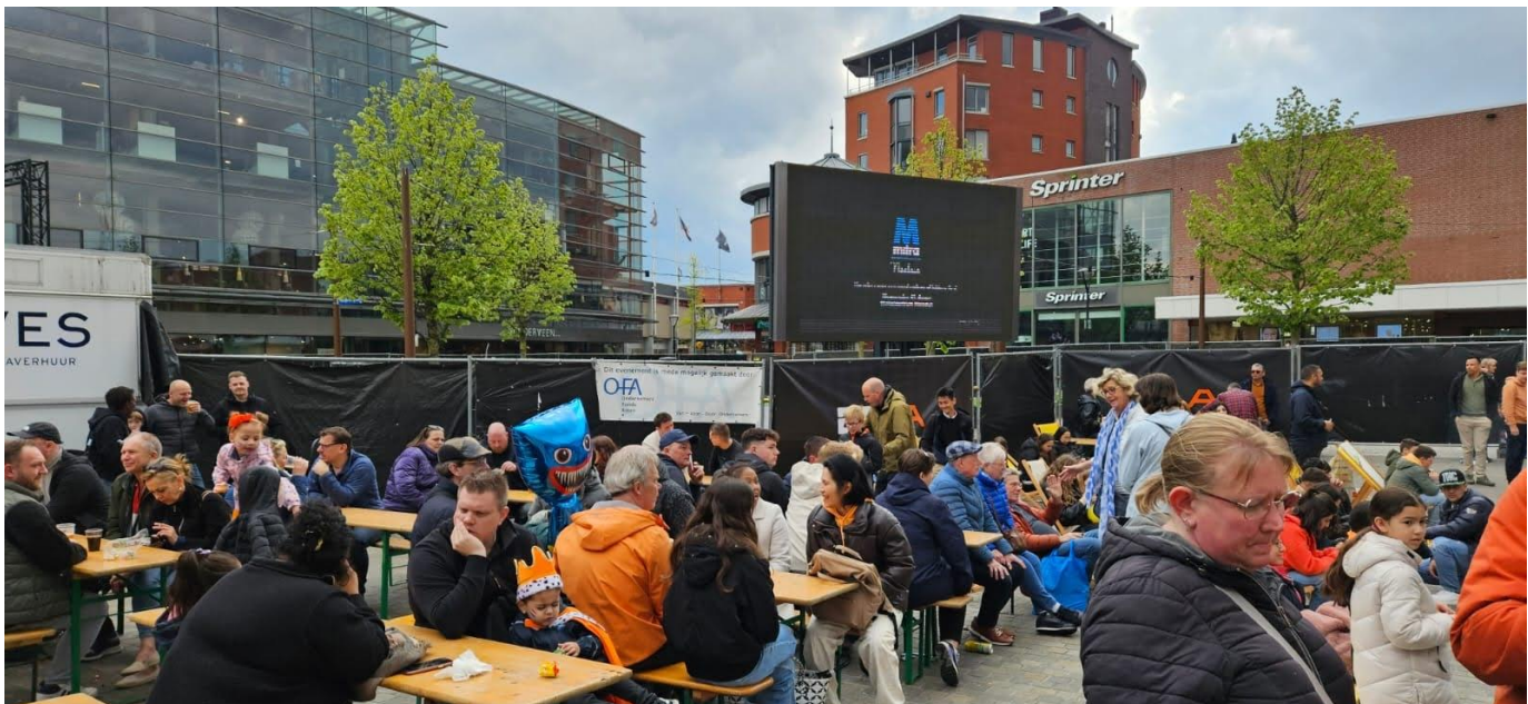
Koningsdag 2024, foto: Wild Events