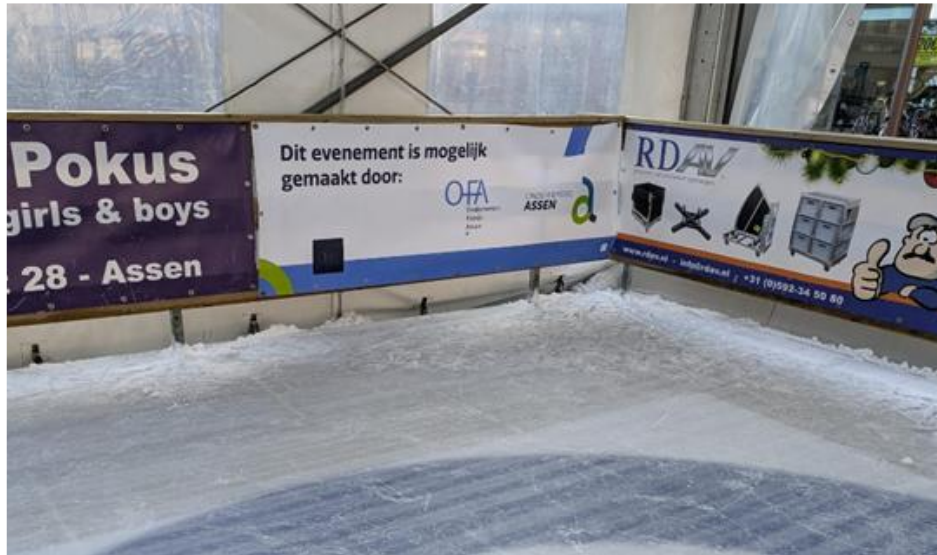
Gezamenlijk spandoek OFA en OA/branches, foto: St. Winters Assen

Nieuw zijn de gezamenlijke OFA/OA spandoeken en banners die ingezet worden bij evenementen die zowel door OFA zelf als door Ondernemend Assen of een van de branches Zorg, Onderwijs en Defensie/Overheid ondersteund worden.