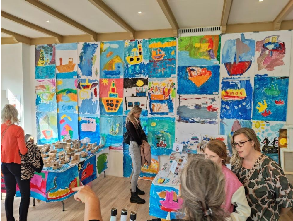
Kunst aan de Vaart – Cultuureducatieproject 800 kinderen, 'Over drijven', foto: Esther van Riezen