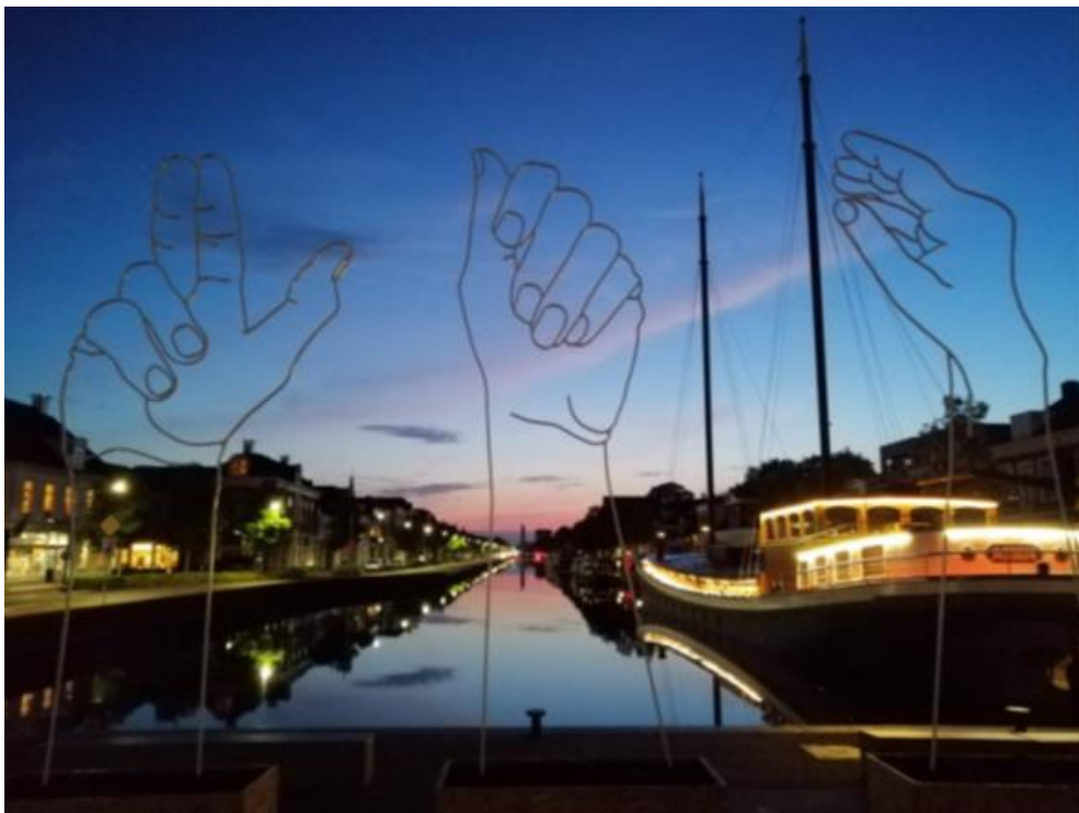
Kunst aan de Vaart, foto: St. Kunst aan de Vaart