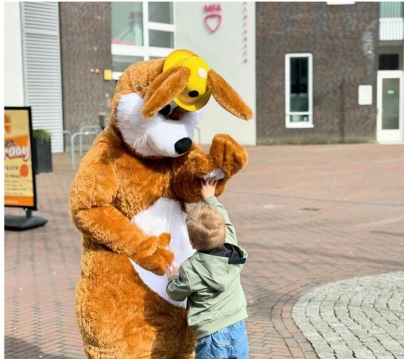
Winkelcentrum Kloosterveste – Paasactie met paashaas

Winkelcentrum Kloosterveste heeft verschillende publieksactiviteiten georganiseerd gerelateerd aan de (feest)dagen zoals Valentijnsdag, Pasen, Koningsdag, Moederdag, Vaderdag, Burendag, St. Maarten, Sinterklaas, Kerst en Oud & Nieuw om te zorgen voor klantenbinding. Ook worden er Super Saturdays en markten gehouden met verschillende thema's.