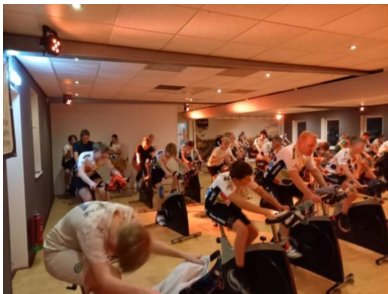
Team Assen naar de Alpe - deelnemers spinningmarathon