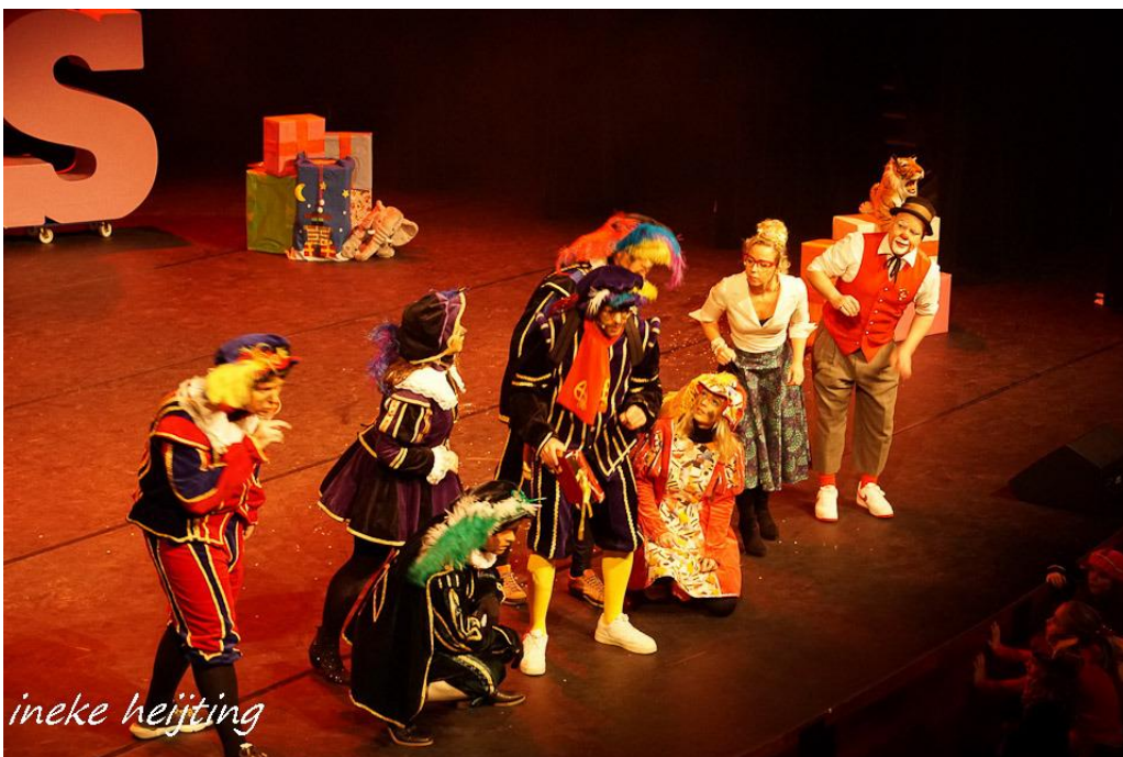
Sinterklaas theater