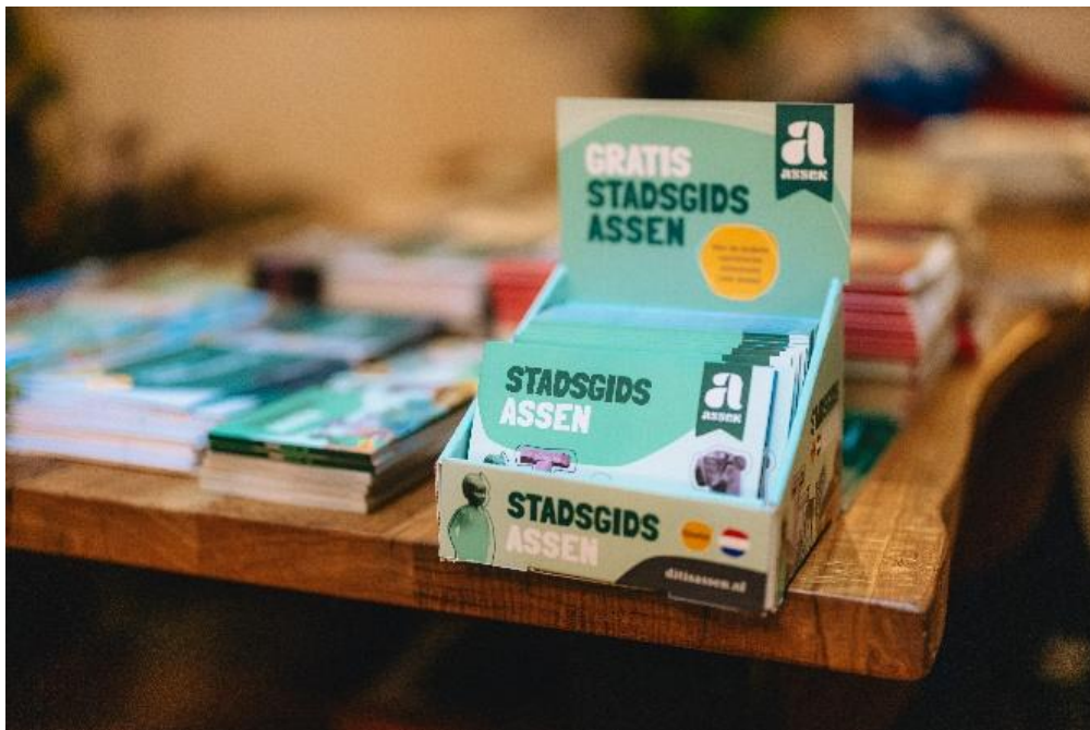
MKB Retail/Vaart in Assen – Stadsgids

3) Communicatie (Bezoekerscommunicatie via platform en socials DitisAssen, producten als stadsgids, stadsplattegrond, evenementenbrochure, etc.).