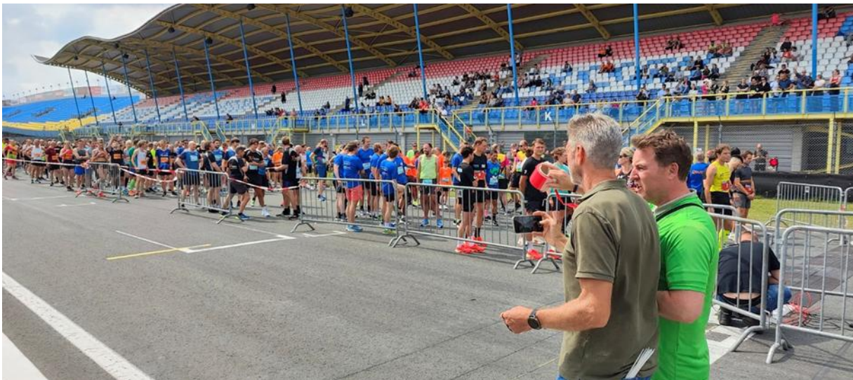
TT City Run