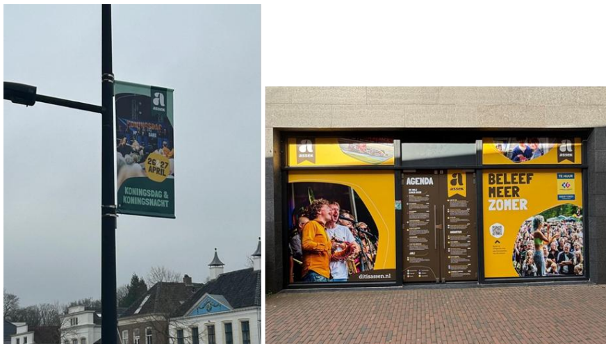
MKB Retail/Vaart in Assen – aankleding van de stad – foto's: Vaart in Assen