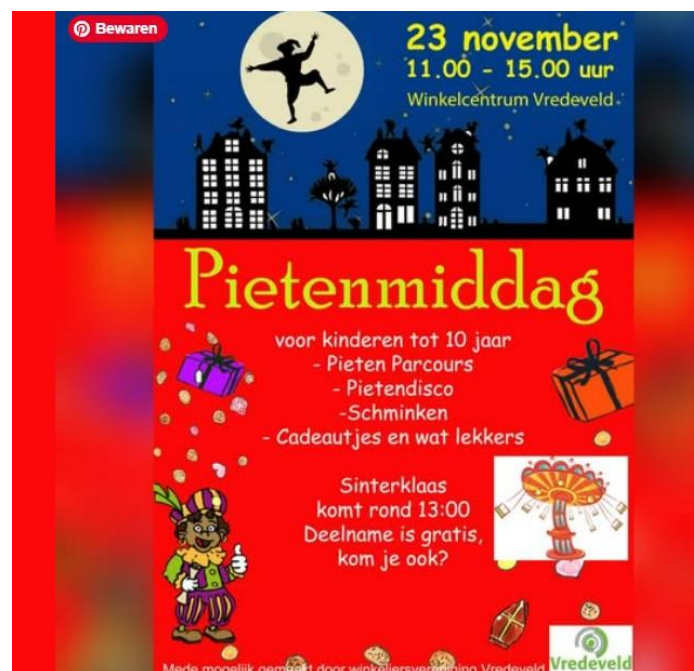
Winkelcentrum Vredeveld – Pietenmiddag, foto: Ploegmakers Beheer

Winkelcentrum Vredeveld heeft verschillende publieksacties georganiseerd gerelateerd aan de verschillende feestdagen. Zo is er een Pietenmiddag gehouden.