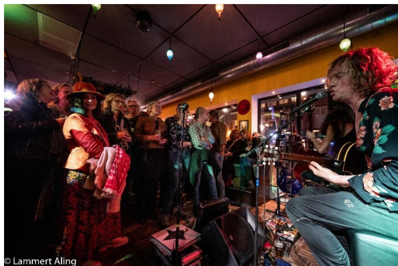
TRP-Assen – Asser Bluesdagen