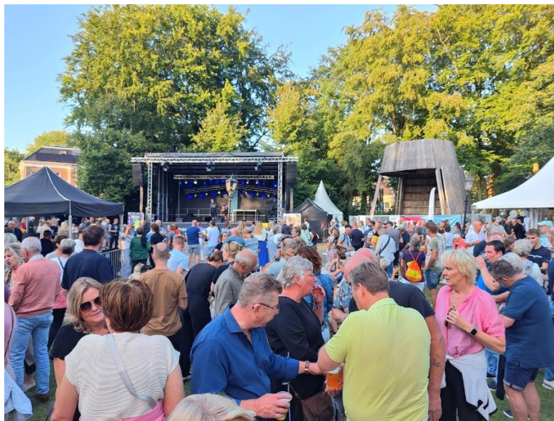
Preuvenement, foto: St. Preuvenement Assen