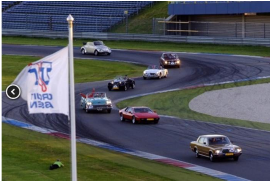
Rally zonder Poespas