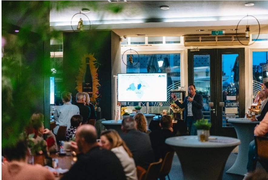
MKB Retail/Vaart in Assen – Netwerkbijeenkomst Binnenstadsborrel

De volgende projecten zijn georganiseerd of er is een bijdrage geleverd: