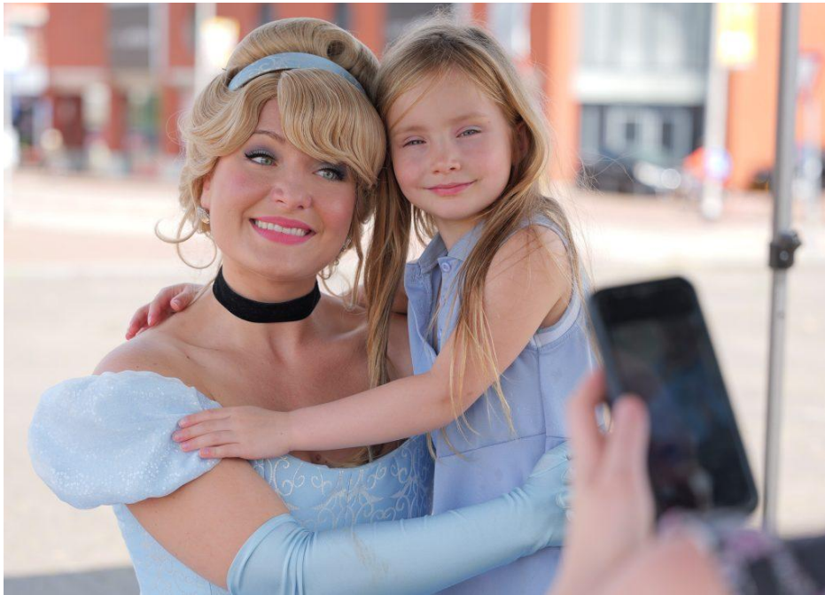
Kids zomervermaak activiteiten - Assepoester