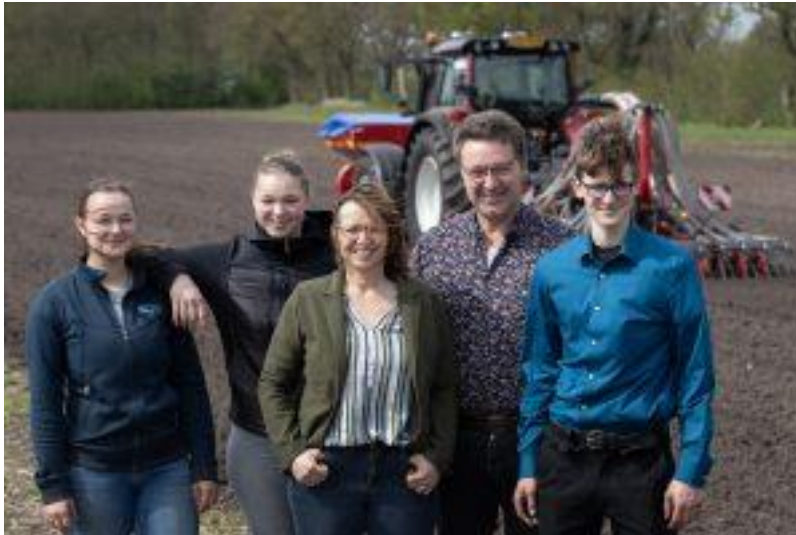
Agrarische sector- Boerenfietstocht 2024

Boerenfietstocht : De jaarlijks terugkerende fietstocht langs 8 agrarische bedrijven op 1, 15 en 29 augustus was, met ongeveer 1500 deelnemers, weer een groot succes. Het waren mooie dagen voor de deelnemers, maar ook voor de bedrijven zelf. De deelnemende bedrijven waren blij met de oprechte belangstelling en de mogelijkheid hun bedrijf te laten zien https://boerenfietstocht.eu/ en het creëren van meer inzicht in hoe het er echt aan toe gaat in de landbouwsector