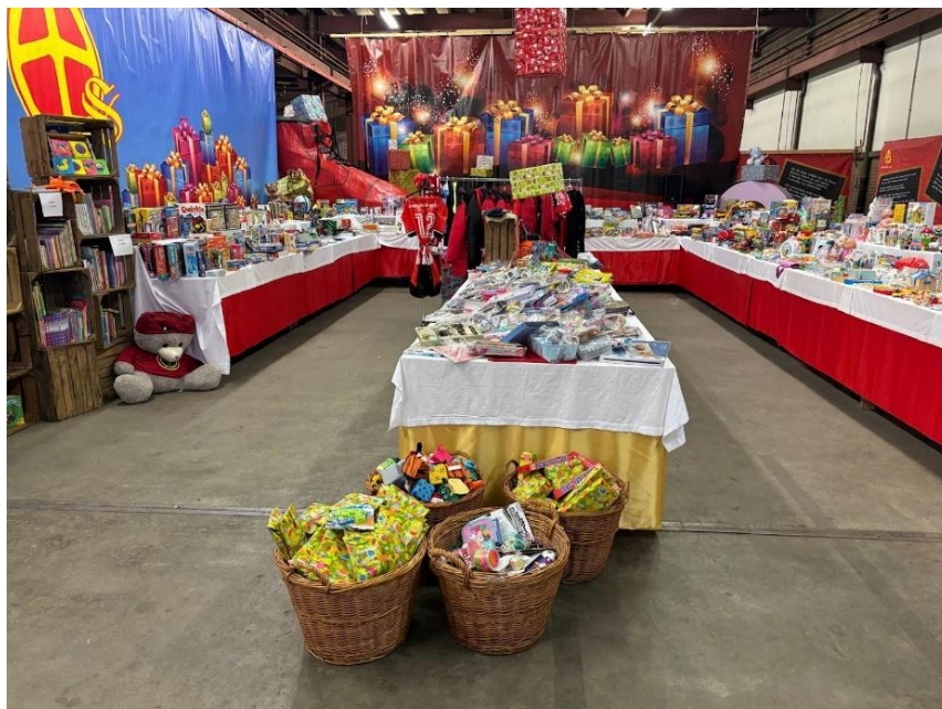
Sinterklaasactie, foto: St. Sinterklaasactie Assen