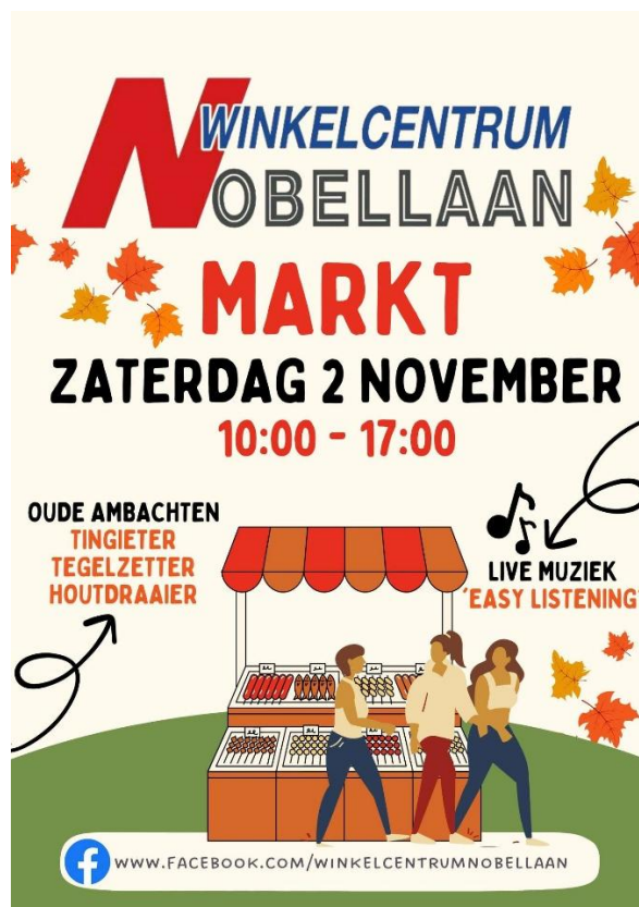
Winkelcentrum Nobellaan – Oude ambachten markt

Winkelcentrum Nobellaan heeft verschillende zeer succesvolle markten georganiseerd met allerlei leuke activiteiten voor de klanten zoals een zweefmolen en een kledjesmarkt. Ook rondom Valentijnsdag, Pasen, Moederdag, Sinterklaas en Kerst is er een activiteit georganiseerd die veel publiek opleverde en daardoor potentiële verkoop voor de ondernemers in het winkelcentrum.