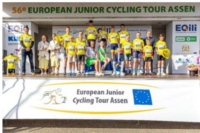
Winnaars European Junior Cycling Tour Assen