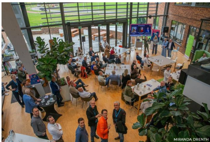
Ondernemend Assen – Energiefestival, foto: Miranda Drenth

Het Energiefestival Assen , dat op 11 april plaatsvond op bedrijventerrein Messchenveld in Assen, was met 170 deelnemers een groot succes. Het festival bood een dynamische omgeving midden op het bedrijventerrein waarbij ondernemers uit diverse sectoren kennis konden maken met de ontwikkelingen en innovaties op het gebied van duurzame energie. Het succes van het Energiefestival Assen benadrukt de mogelijkheden voor verdere samenwerking tussen bedrijven, gemeente en maatschappelijke organisaties om duurzame energie-initiatieven te bevorderen en te versnellen.