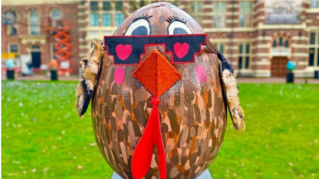
MKB Retail/Vaart in Assen – Paaseieren op de Brink

3) Communicatie (Bezoekerscommunicatie via platform en socials DitisAssen, producten als stadsgids, stadsplattegrond, evenementenbrochure, etc.).