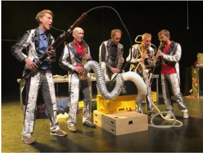
Muziekkamer Assen

Bij meerdere projecten hebben een of meerdere trekkingsgerechtigden ook een bijdrage verleend. Dit getuigt van betrokkenheid bij het belang van het centrum voor de stad.