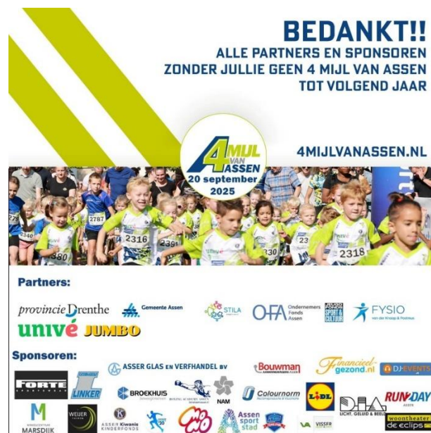
Winkelcentrum Marsdijk – 4 Mijl Assen