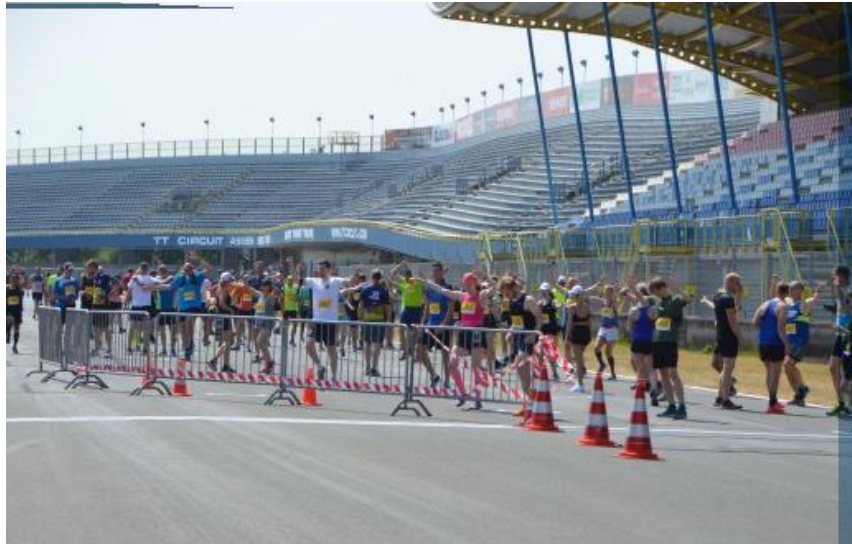
TT City Run

Ook vindt er weer een symposium plaats voor medewerkers in de Zorg, dit keer over “Je grenzen stellen” op 5 oktober a.s. in De Nieuwe Kolk.