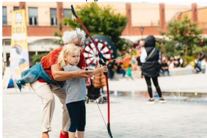
Vaart in Assen