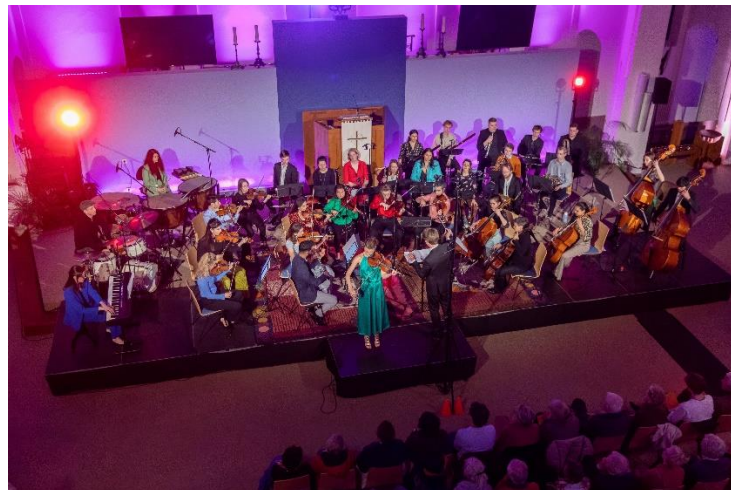
Somertijd concert in Jozefkerk