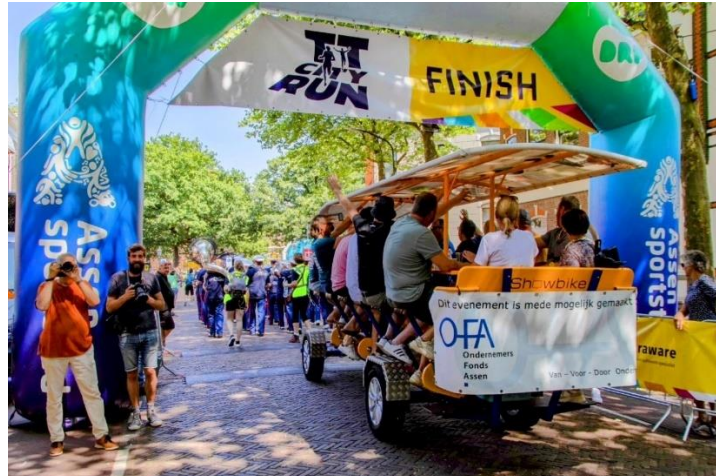
TT Festival openingsparade