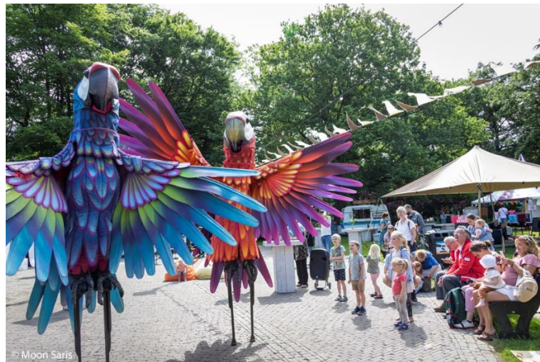
Art of Wonder festival