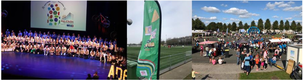
Sector Sport – diverse evenementen

Naast genoemde financiële ondersteuning heeft Stichting Assen Sportstad vanuit het OFA budget een vergoeding toegekend aan Team Assen naar de Alp. Team Assen heeft met deze bijdrage een grote bijeenkomst in De Nieuwe Kolk kunnen organiseren.