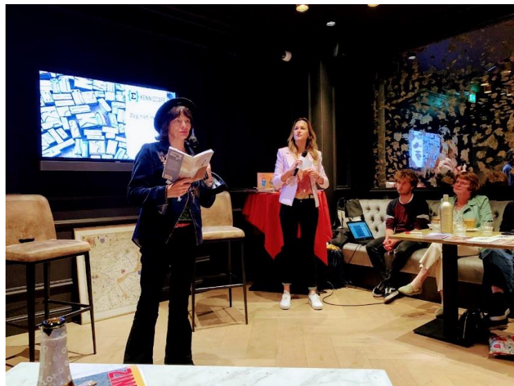
Kenniscafé Assen