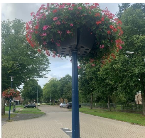
Winkelcentrum Vredeveld bloembakken – foto: Ploegmakers beheer