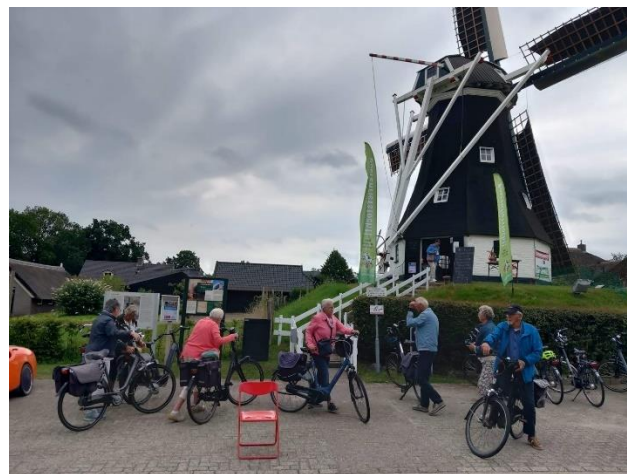
Sector Agrarisch – Boerenfietstochten

Daarnaast is educatie op scholen nog iets wat de komende periode kan worden opgepakt samen met de branche Onderwijs vanuit Ondernemend Assen.