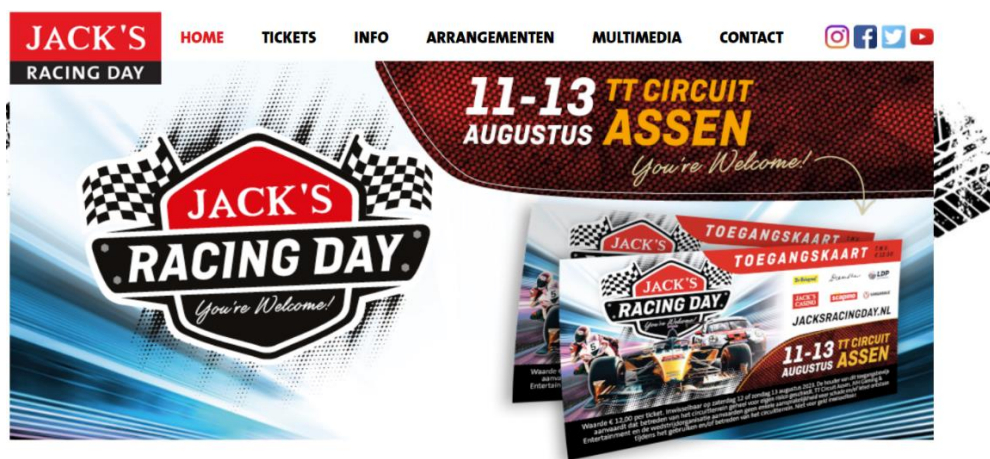
TRP - Jacks Racing Day

Het evenement Jack's Racing Day is een groot, jaarlijks terugkerend event op het TT Circuit. TRP Assen heeft belang bij de organisatie van dit soort evenementen. Het levert bezetting op in de hotels, reuring in de stad en landelijke positieve berichtgeving. Kortom een bijdrage is meer dan vanzelfsprekend.