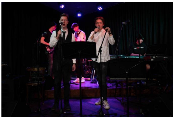
Asser Bluesdagen – organisatie Asser Bluesdagen