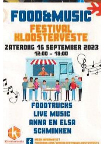
Food & Music Festival Kloosterveen