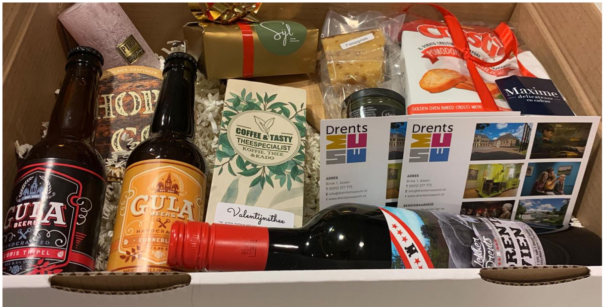
Vaart in Assen – Valentijnsbox