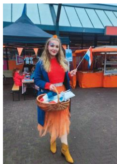
Winkelcentrum Nobellaan