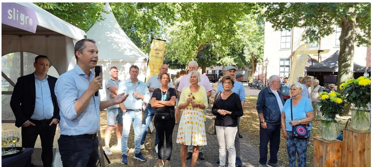
Preuvenement – Ondernemend Assen Ondernemersborrel, foto: Esther van Riezen