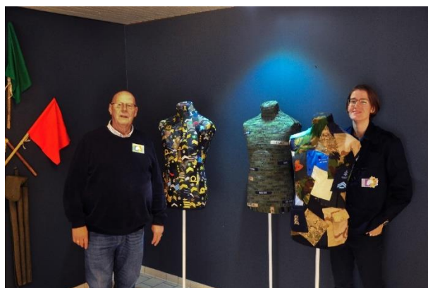
Branche Defensie/Overheid – Helmen vol Verhalen