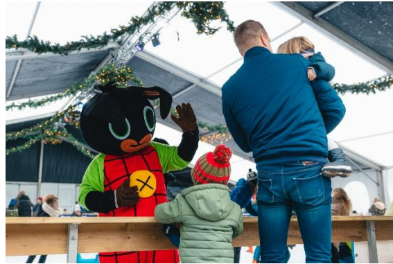
MKB Retail/Vaart in Assen – Familieschaatsen

In dit Jaarverslag treft u op hoofdlijnen aan waar de budgetten zoal aan besteed zijn per trekkingsgerechtigde. Ook de toekenningen vanuit het Stadsbrede budget, waar het OFA-bestuur zelf mandaat over heeft, worden toegelicht.