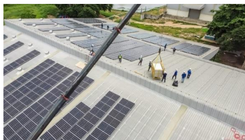
Project Zon op de Zaak -Stockfoto