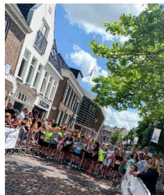
Asser Stadsloop