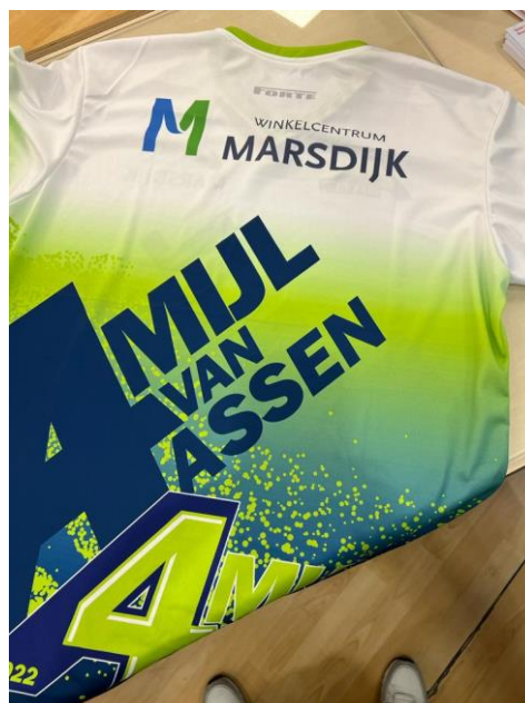
Winkelcentrum Marsdijk – 4 Mijl