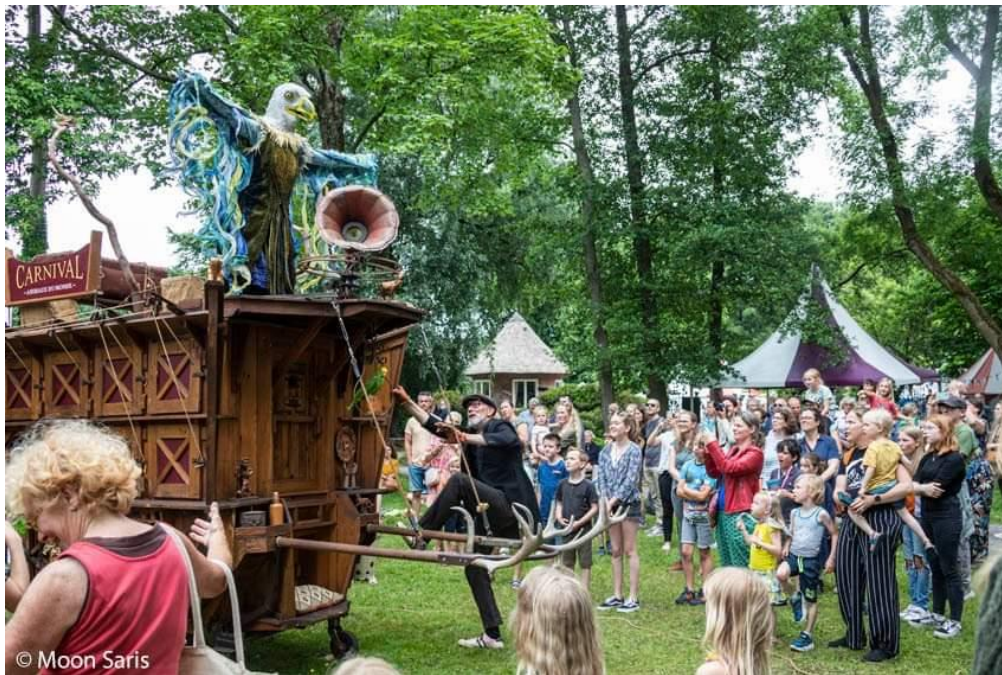
Art of Wonder

Er zijn verschillende publieksacties georganiseerd gerelateerd aan (feest)dagen zoals Burendag, markten en een Sinterklaasactie. Dit zorgt voor veel publiek en potentieel hogere verkoop.