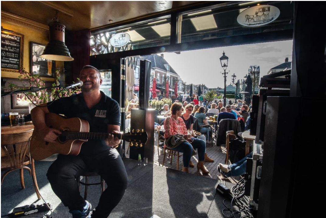
Asser Bluesdagen