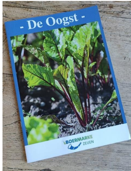
Agrarische sector- eerste krant De Oogst, foto: Esther van Riezen

De eerste uitgave van de krant Oogst is verschenen https://boermarkezeijen.nl/de-oogst-gepubliceerd/