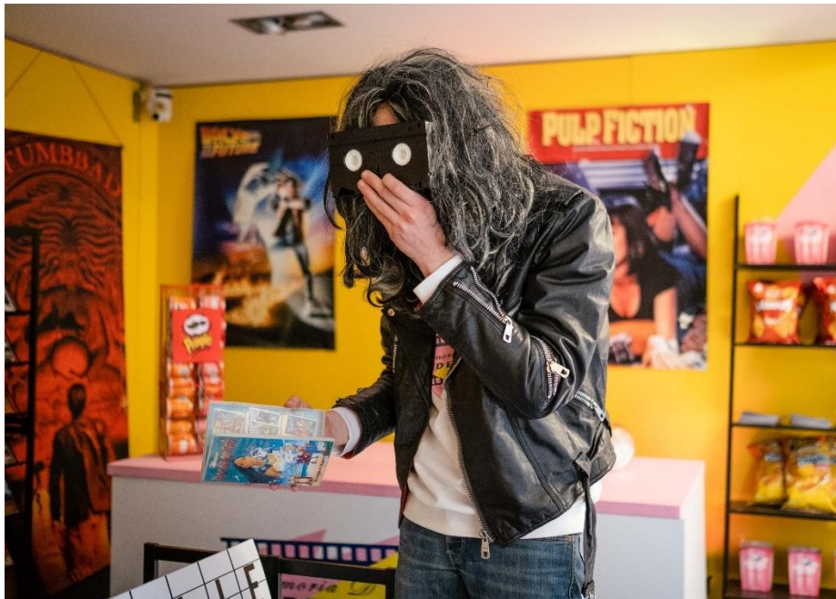
Garage TDI jeugdtheater - Laatste videotheek van Assen

10. Garage TDI jeugdtheater - Laatste videotheek van Assen