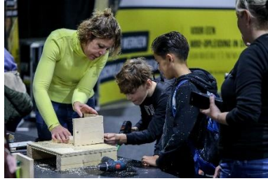
Branche Onderwijs, Techniek Tastbaar voor basisscholen