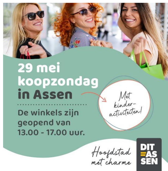
MKB Retail/Vaart in Assen – Koopzondag