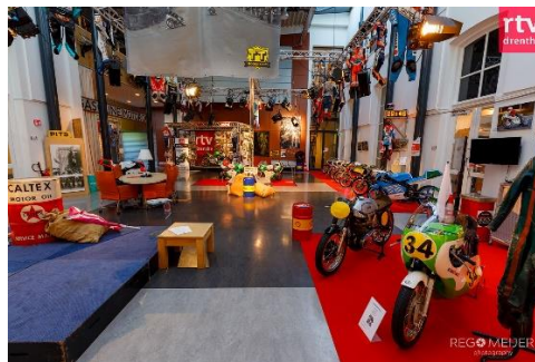
Tijdelijk TT-museum bij RTV Drenthe