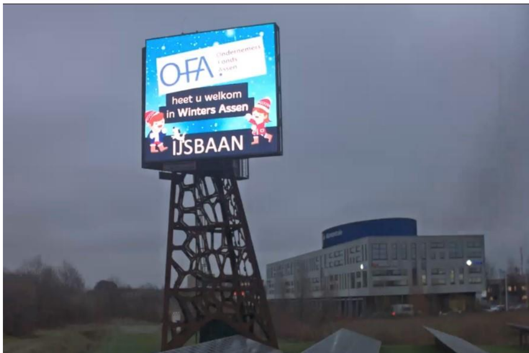
Winters Assen ijsbaan, foto: Winters Assen

Organisaties die financiële ondersteuning voor hun projecten hebben ontvangen hebben goed gebruik gemaakt van de OFA-banners, OFA-spandoeken of digitale logo's. De zichtbaarheid van het OFA is hiermee weer verder verbeterd.