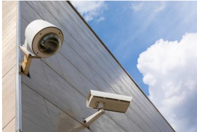
Project Schoon, heel, veilig