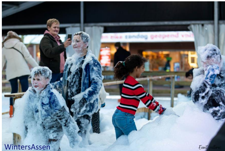
Winters Assen ijsbaan, Schuimparty