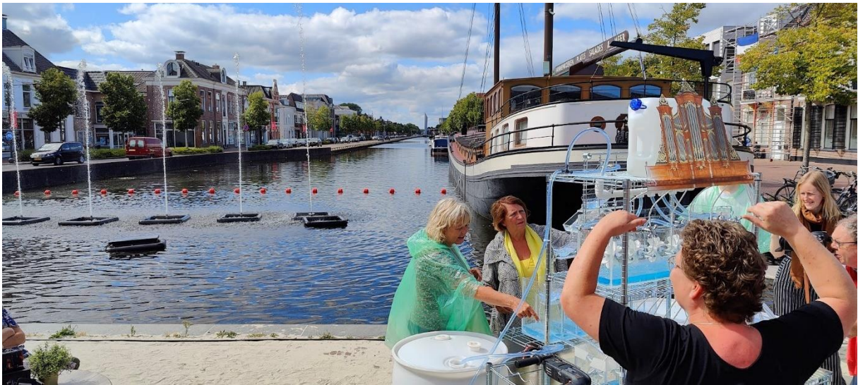
Kunst aan de Vaart – opening Waterorgel in de Vaart