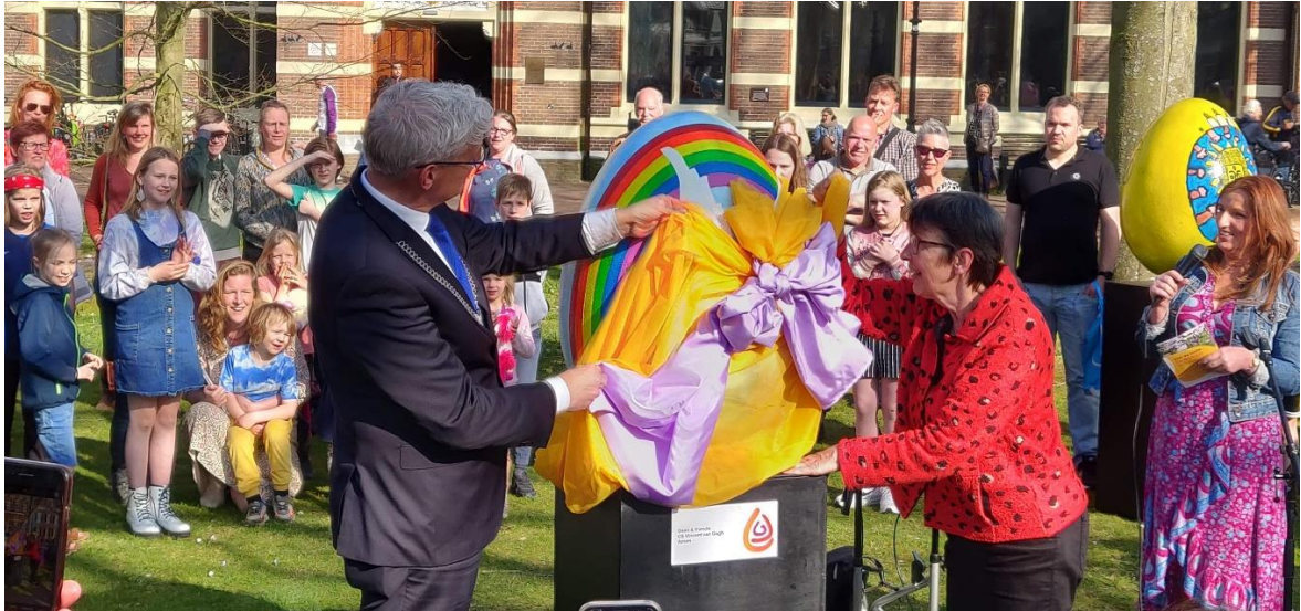
Paaseieren op de Brink