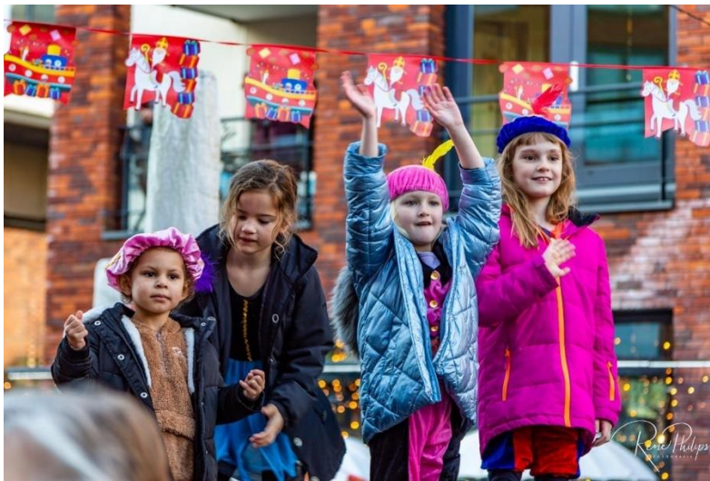
Winkelcentrum Marsdijk – Sinterklaasintocht, foto: René Philips

Frequent worden er acties en activiteiten georganiseerd voor de consument. Er is een bijdrage geleverd aan de 4 Mijl van Assen en aan de organisatie van de Sinterklaasintocht.