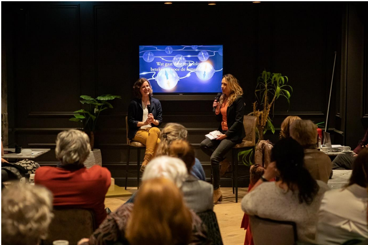
Kenniscafé Assen

19. Film Festival of the Middle East (MEFF)