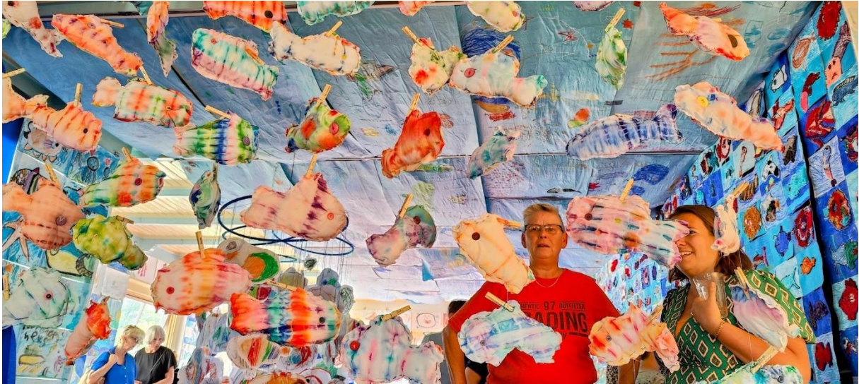
Kunst aan de Vaart – scholenproject, foto: Esther van Riezen