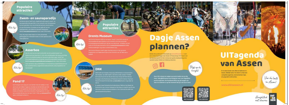
MKB Retail Assen/Vaart in Assen – Uitagenda