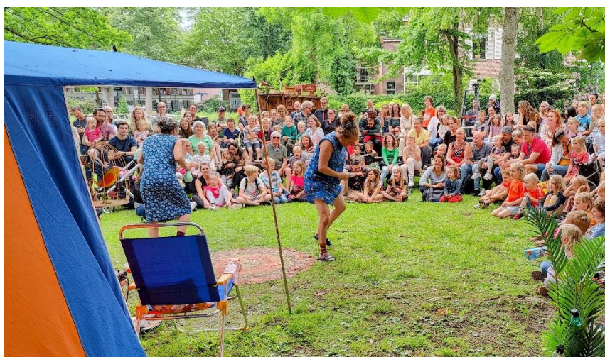
Art of Wonder

De verdeling van het budget 2022 was als volgt ( euro's):