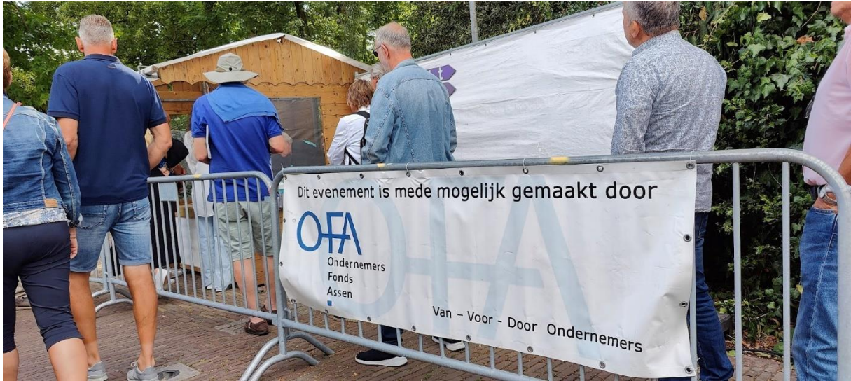
Preuvenement, foto: Esther van Riezen