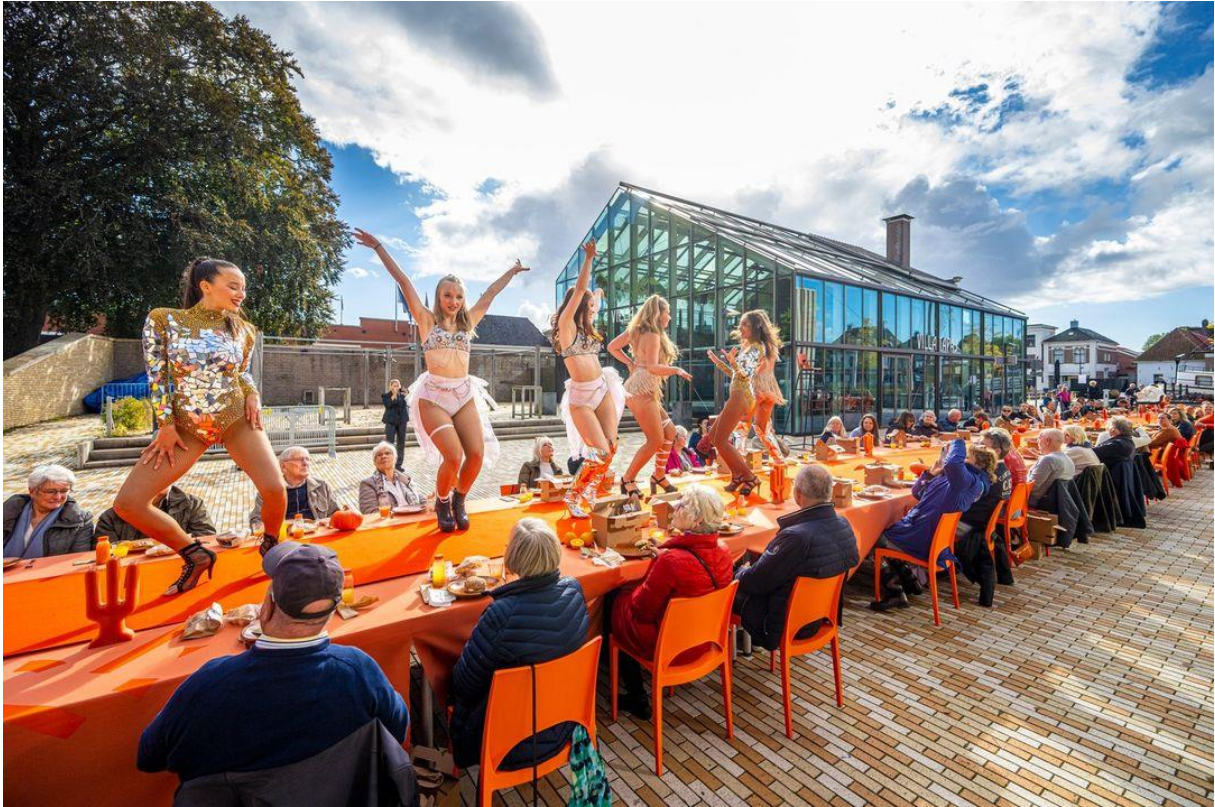
DNK – Catwalklunch 10-jarig jubileum