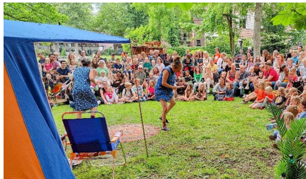
Art of Wonder – Jeugdtheater festival

Het OFA-bestuur wens u een ontspannen en goede zomerperiode toe!