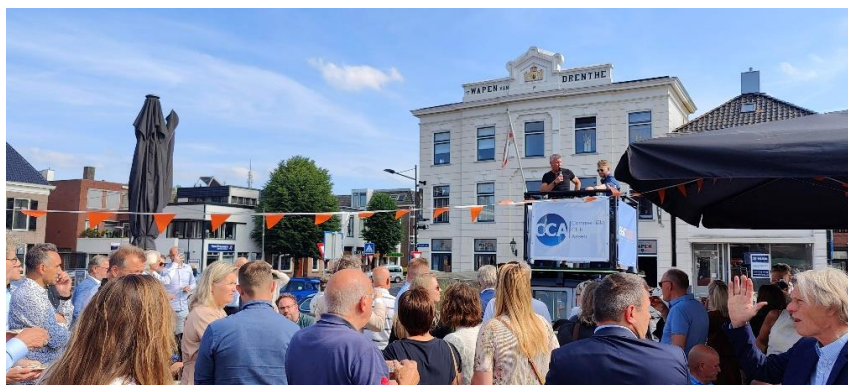
Haringparty Kop van de Vaart