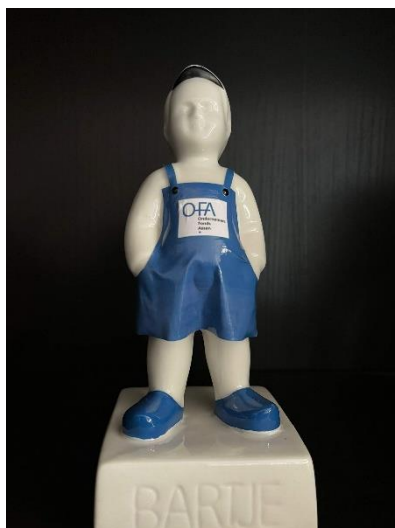
Bartje in OFA-uniform