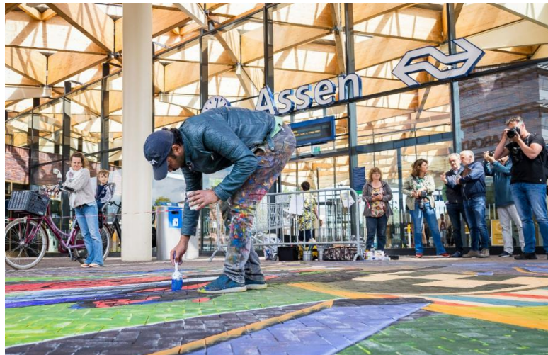
TRP-Assen – Street Art voor het station