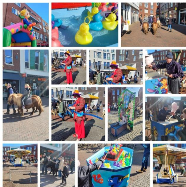
Mini Kermis Kloosterveste

Inzake winkelcentrum Nobellaan is het OFA budget onder meer gebruikt voor: