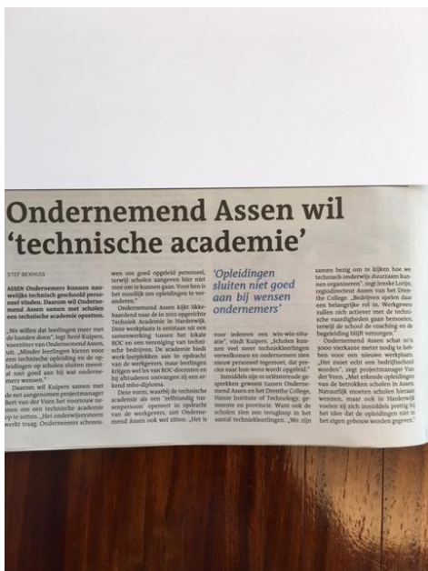
Artikel uit DvhN 14.06.2018